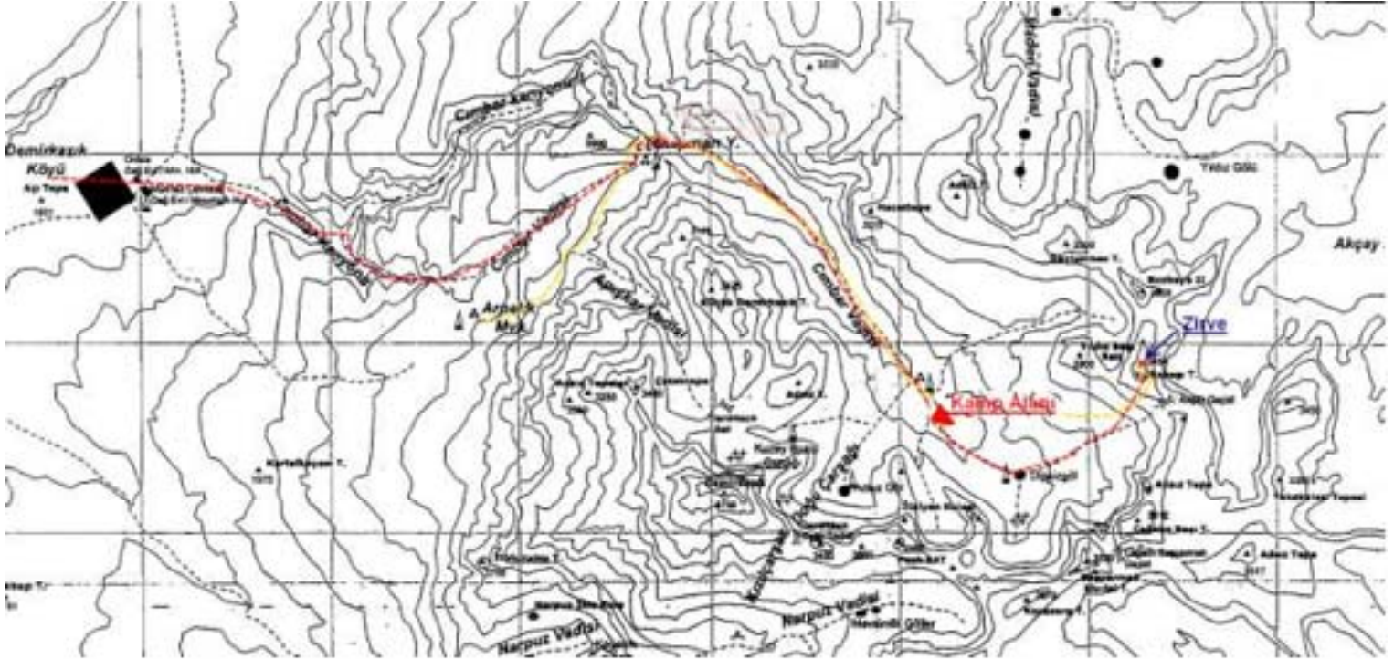
Harita 1 Faaliyet boyunca izlenen rota