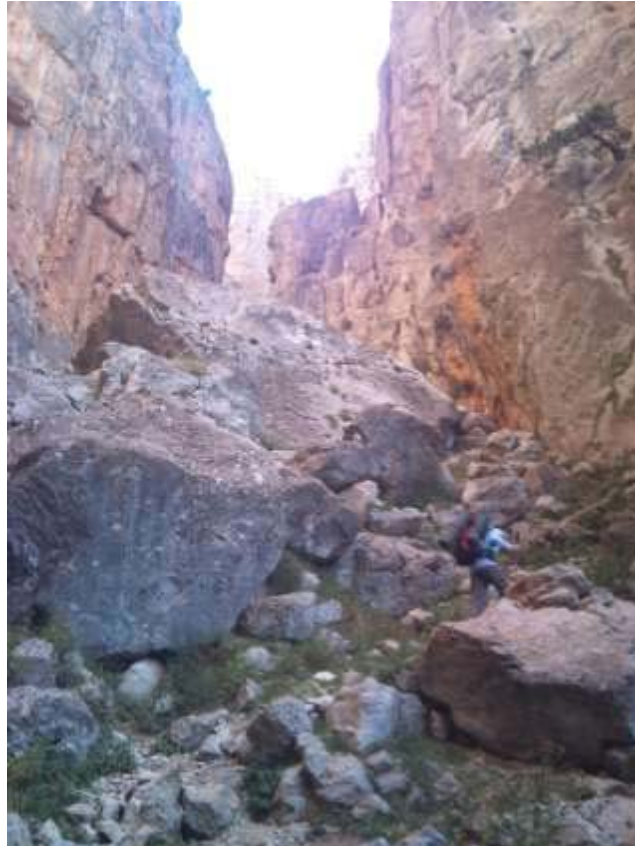
Foto 1 Cimbar vadisi

11.30: Demirkazık Dağevinden Cimbar vadisi içinden yürüyüşe başlandı