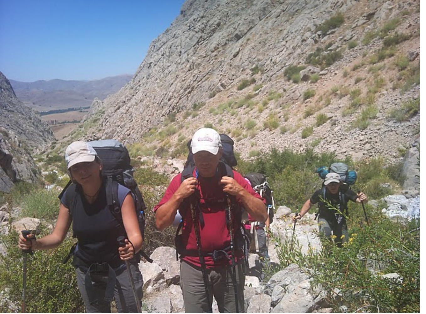
Foto 2 Cimbar vadisi

Traktörle çıkmak yerine bu vadinin güzelliğini seyrederek yürümek çok keyifliydi. Yürüyüşün ortalarında karşımıza çıkan kaya heyecan verici anlardan biriydi. Sırtımızdaki yüklerle kaya tırmanışın adı yüklü lider olmalı:) Vadi sonlara doğru daralan bir boğaz şeklini alıyor tam bu bölümde doğanın hediyesi olan suyun başında mola verdik. Ardından Tekepinarı istikametine doğru yürüyüşe devam ettik. Tekepinarının dondurucu soğuk suyuna yorgun ayaklarımızı en fazla 5 saniye aralıklarla daldırırken tüm yorgunluğumuz akan suyla birlikte gitti.