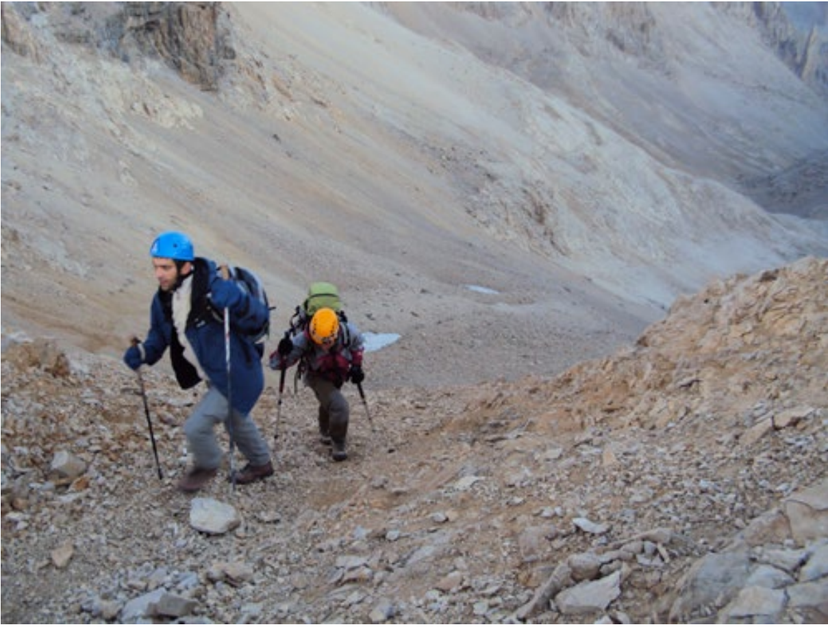
Buradan sırt rotasını izleyerek önce yoncalıtaştan mevkiye sonrada kaldıbaşı külâhının dibine geldik