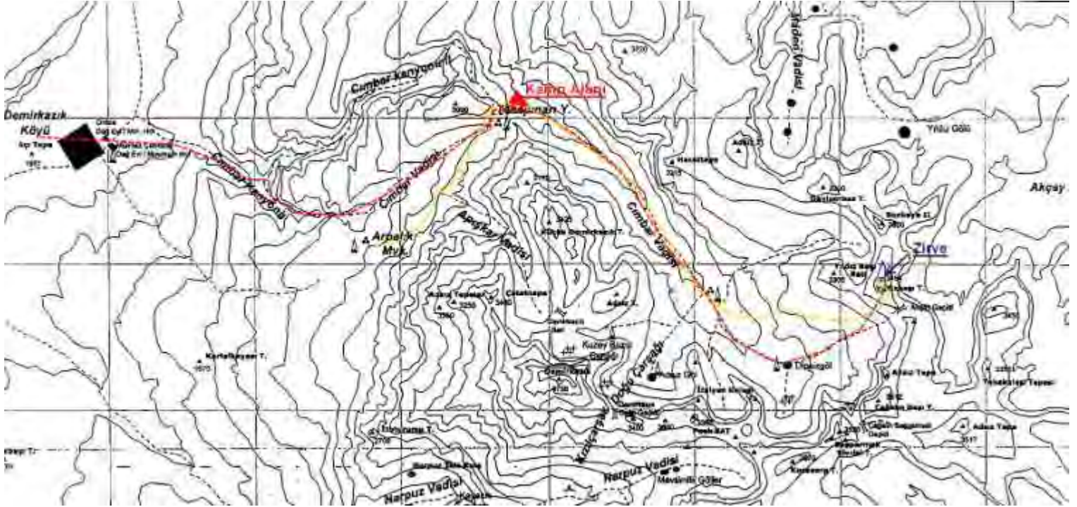
Harita 1 Faaliyet boyunca izlenen rota