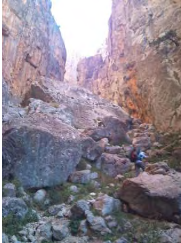
Foto 1 Cimbar vadisi

14.00: Demirkazık köyü yol ayrımından Cimbar vadisi istikametinde yürüyüşe başlandı