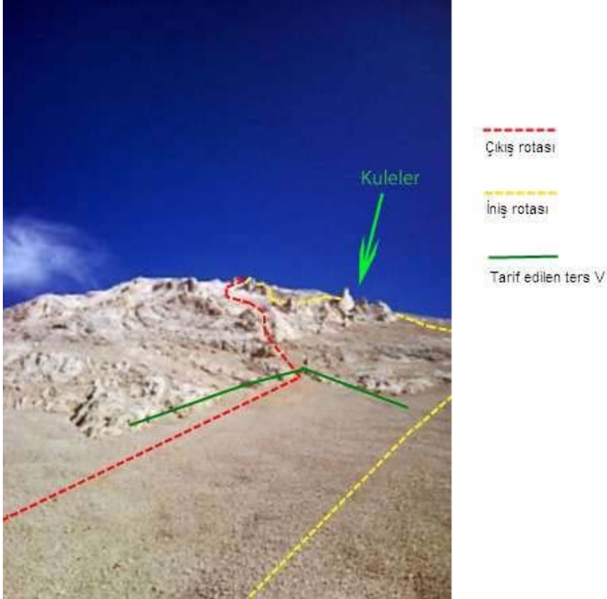
Foto 3 Çıkış ve İniş Rotaları