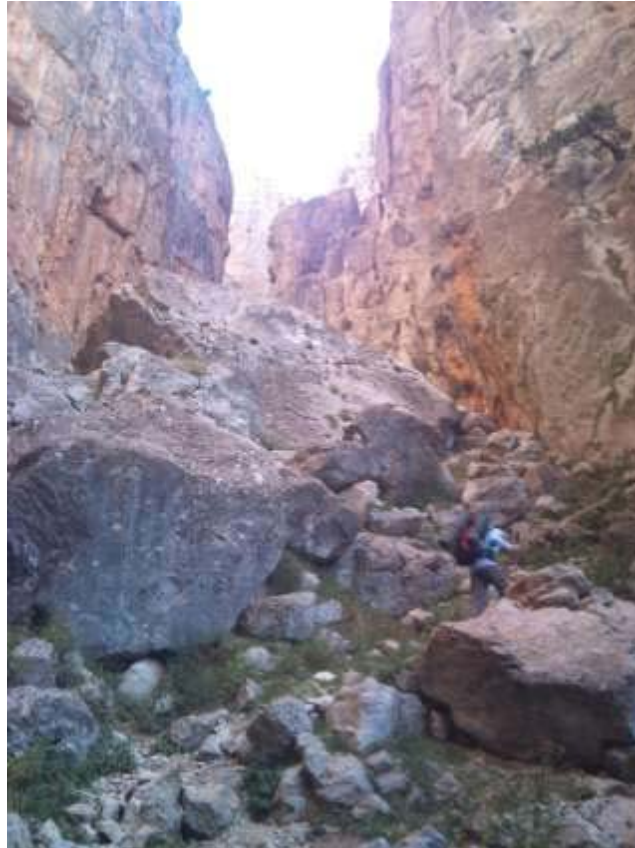
Foto 1 Cimbar vadisi

11.30: Demirkazık Dağevinden Cimbar vadisi içinden yürüyüşe başlandı