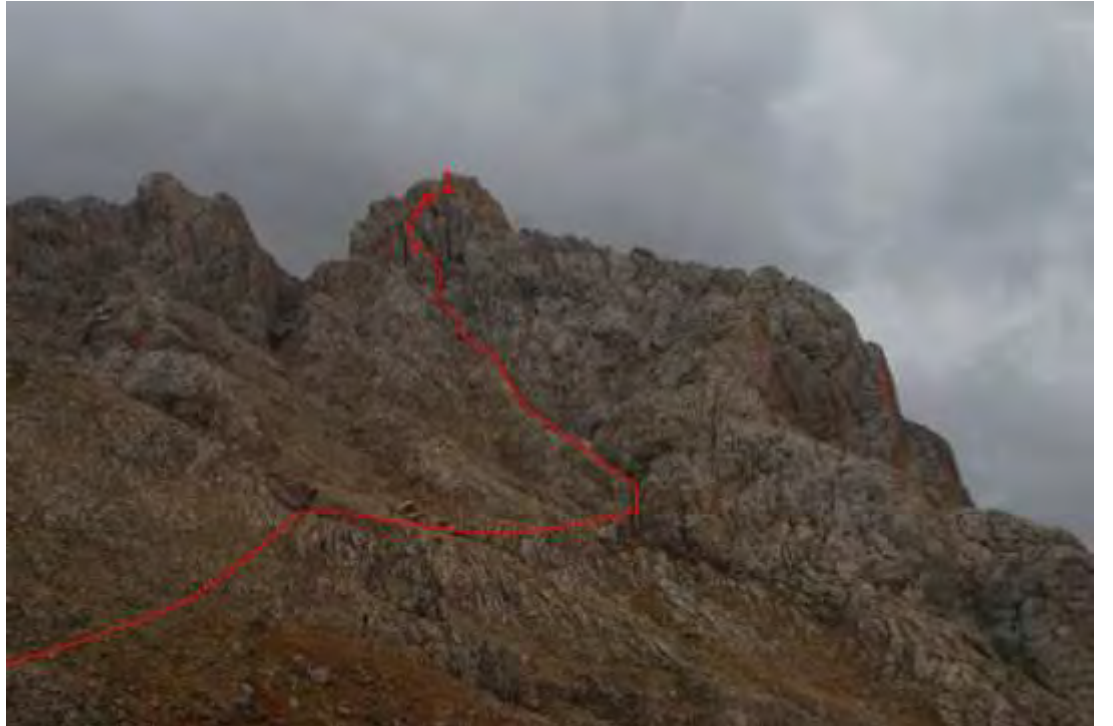
Resim 3 Arpalık yayla patikasından rota görünümü (Kuzeybatı-güneydoğu istikametinden)