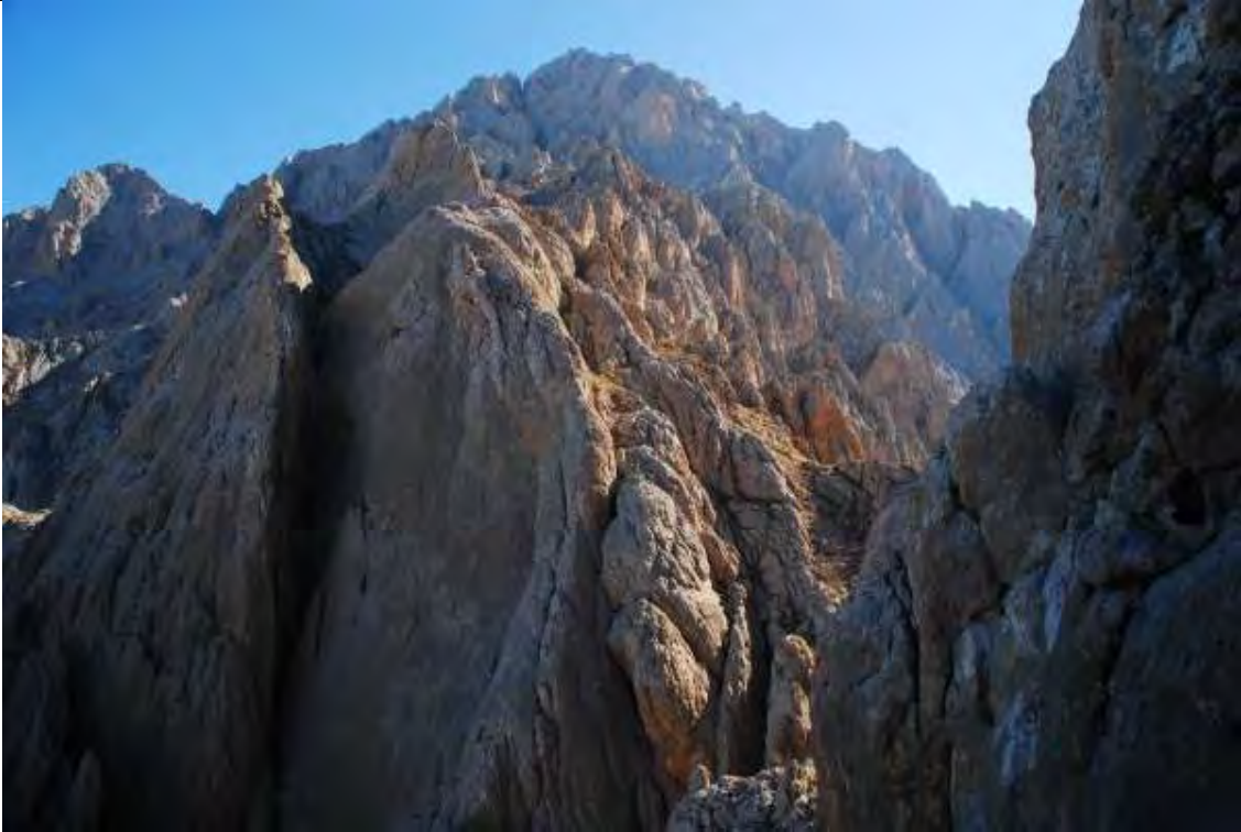
Resim 7 Büyük Demirkazık batı yüzü