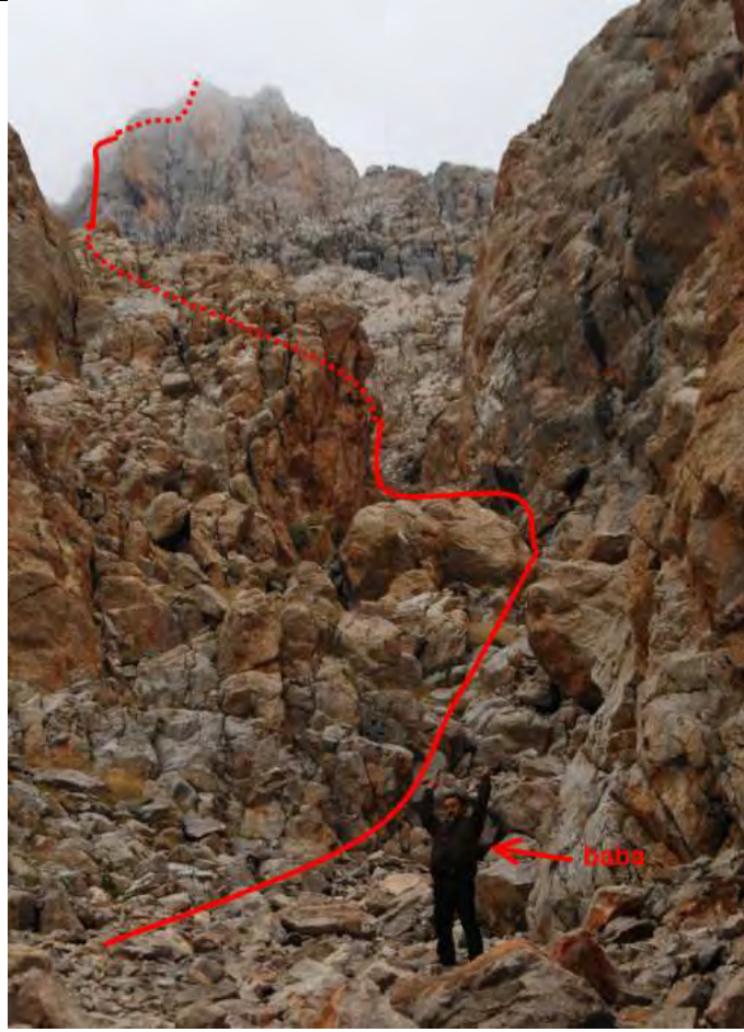
Resim 6 Kulvar girişinden rota