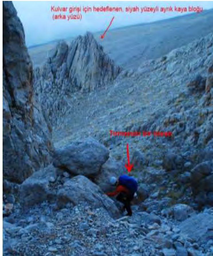
Resim 5 Kulvar içinden kulvar başlangıcına bakış

Arpalık yayladan irtifa almadan ve kaybetmeden güneye doğru düşük tempolu 50dk'lık bir yürüyüş sonrası, uzaktan görünce hedeflediğimiz, yüzeyi yer yer siyah lekeli 15-20mt'lik ayrık blok düşündüğümüz gibi bizi geniş kulvar girişine götürdü (Resim 4,5). Saat 6.50.