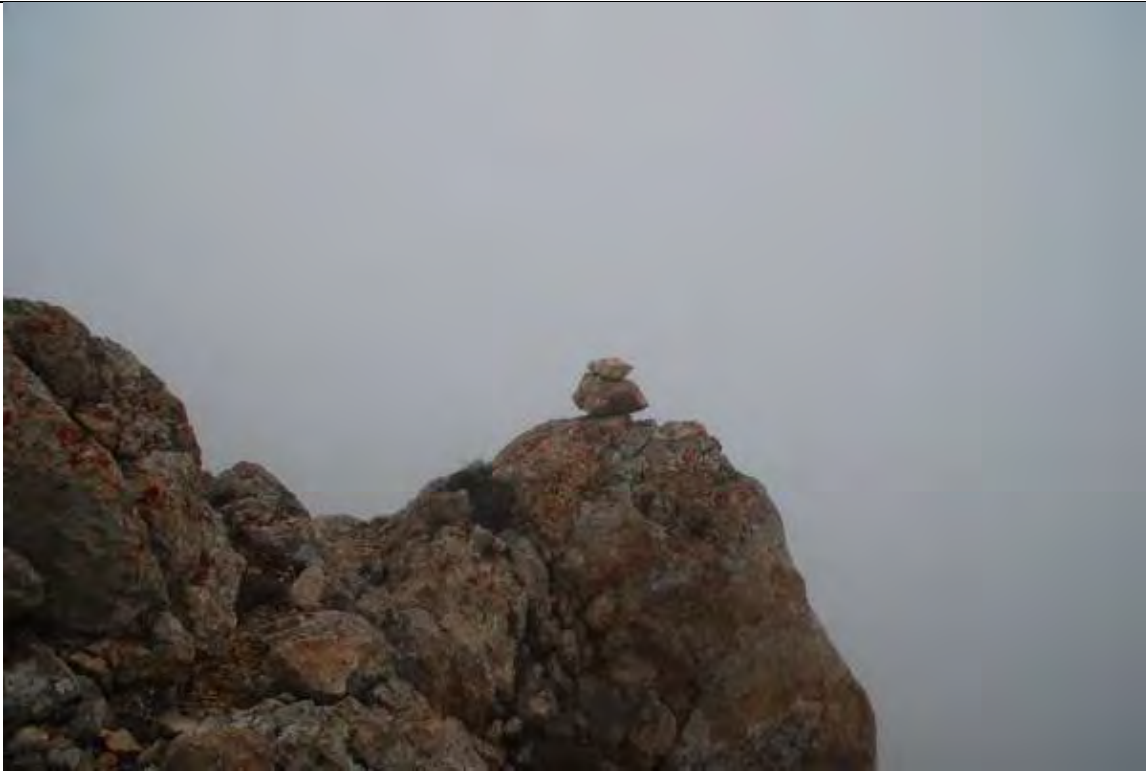
Resim 9 Zirveden Aladağlar manzarası...