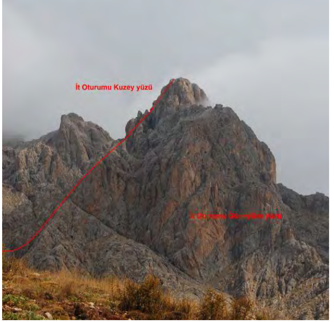
Resim 2 Arpalık yayla-sokullupınar yolundan takribi rota görünümü ve güney-batı yüzü