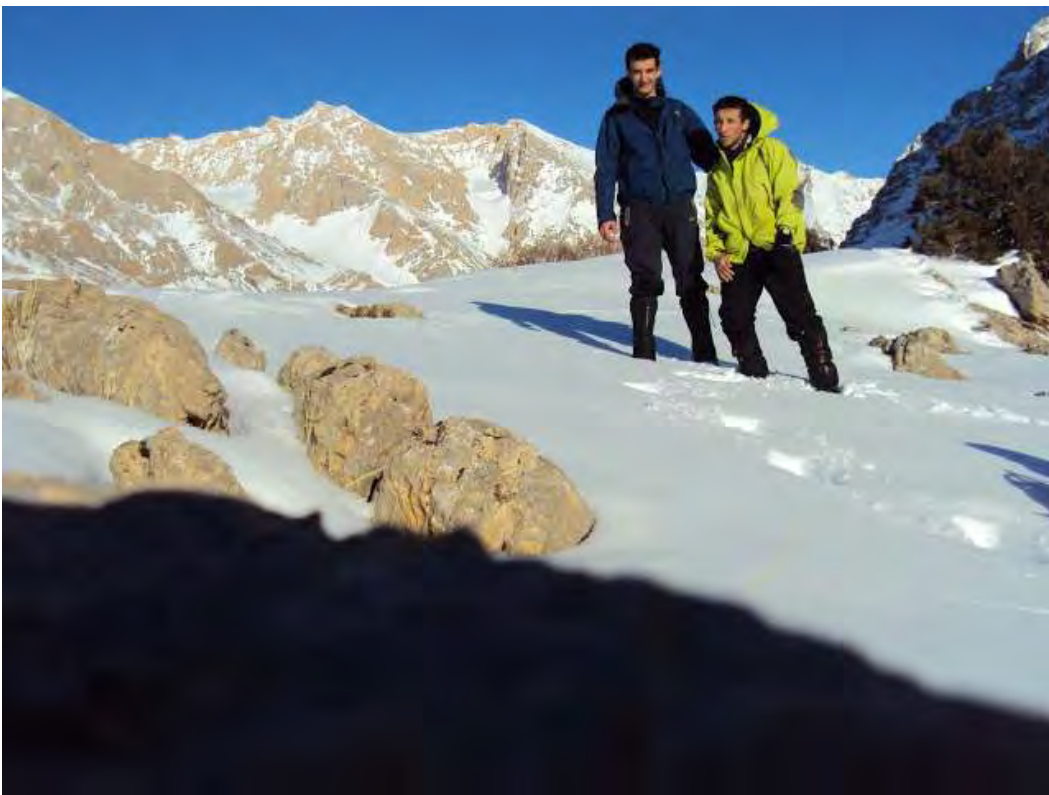
Resim 11 , Zirve. Sağdan kuvvetli rüzgar...

Güneşle eriyen ıslak karlı hafif rampada yavaşça ilerleyerek zirve platosuna varıyoruz (15.05).