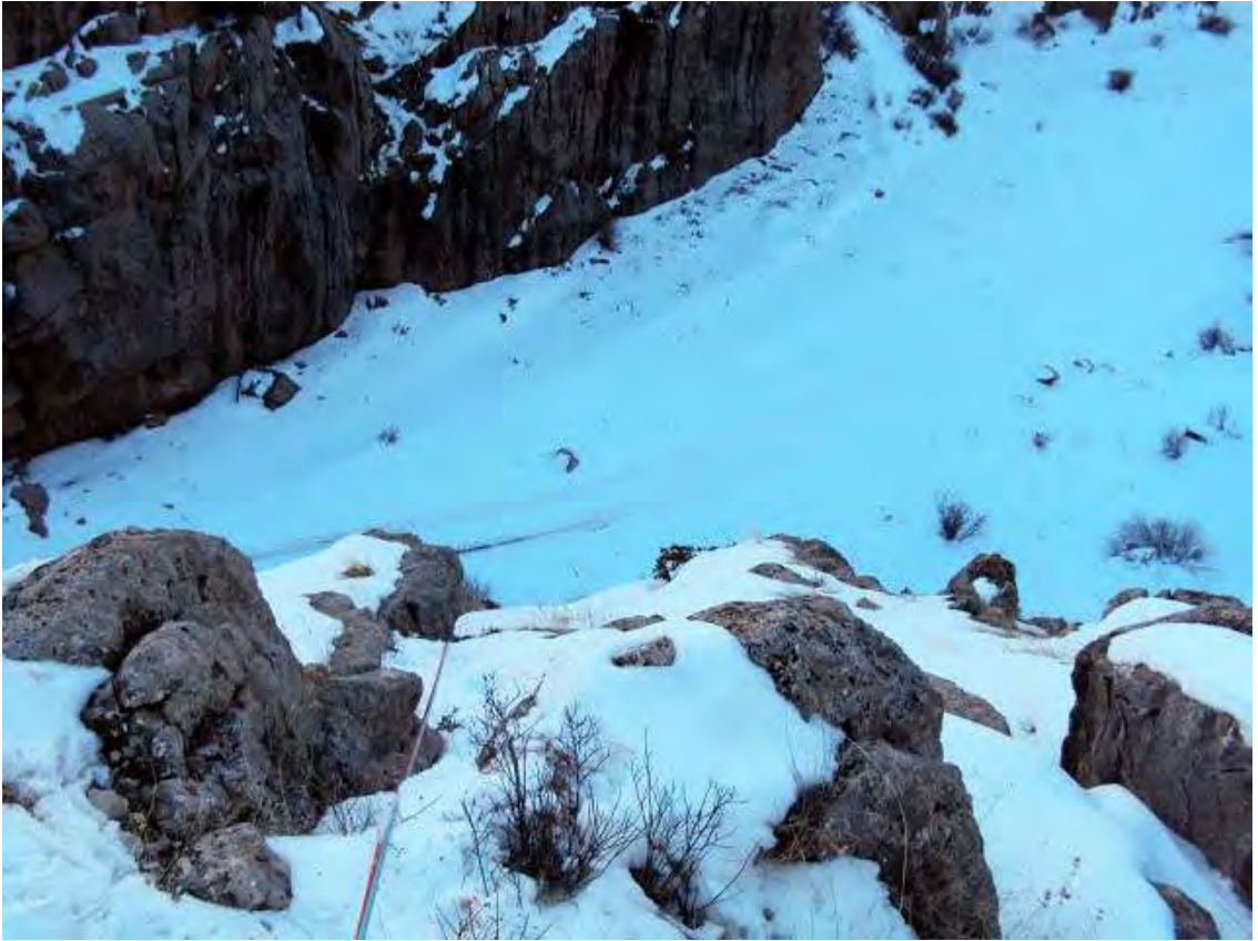
Resim 3, Sarımemetlerde mix tırmanış oyunu