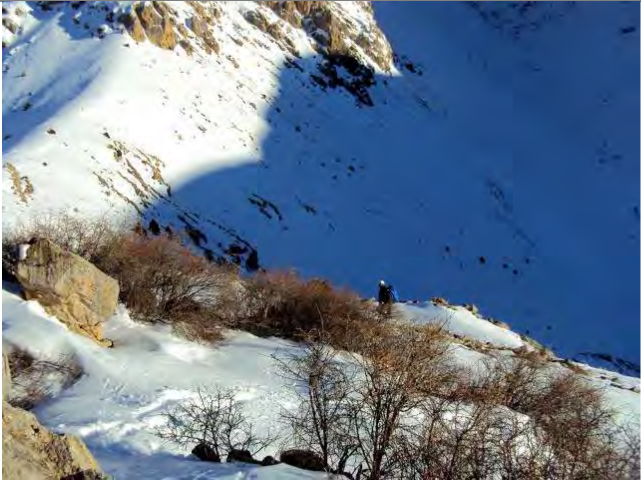
Resim 12, İniş yolunda