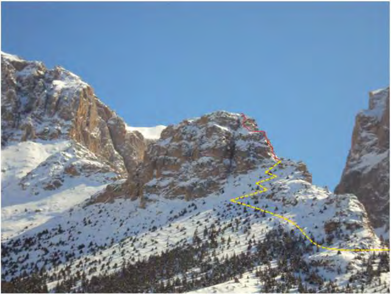
Resim 1, Kamp alanından rota görünümü