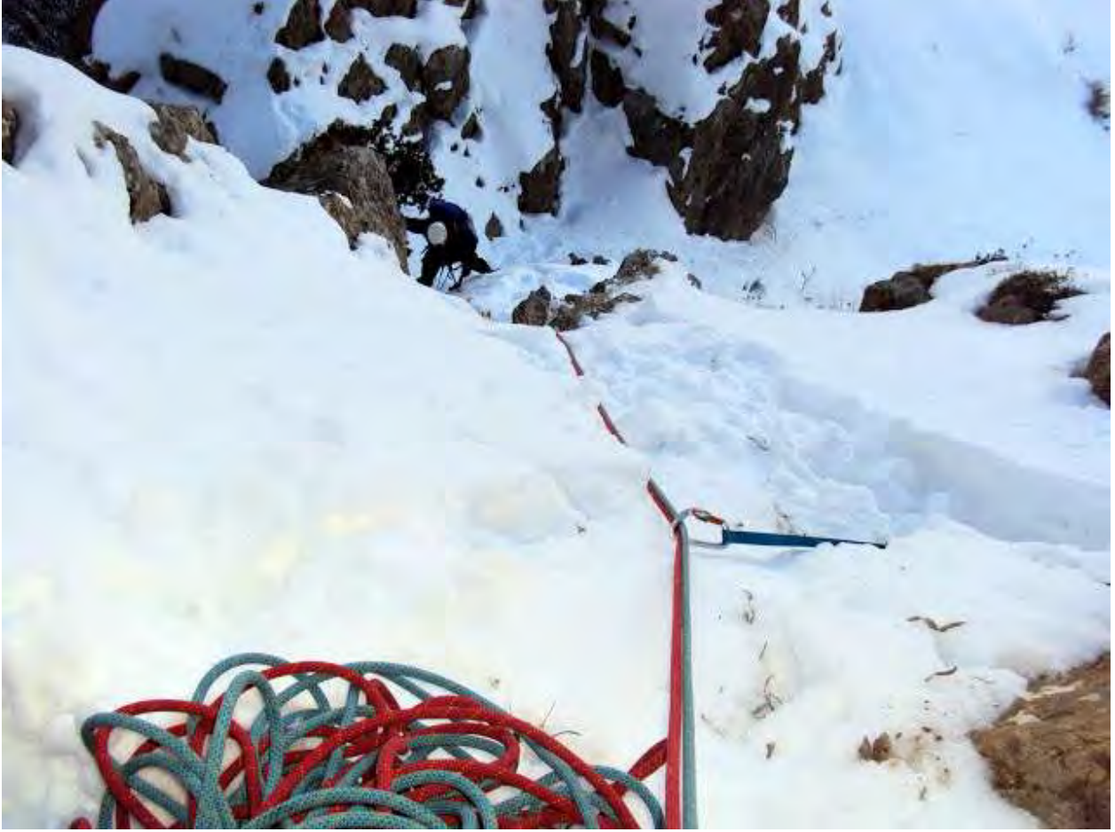
Resim 5, I. İp boyu