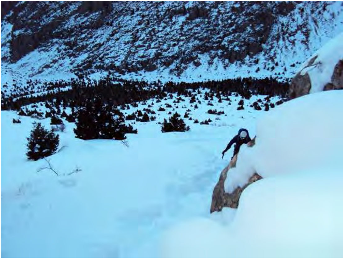
Resim 4, Yaklaşım

5 Şubat sabahı saat 5'te Sarımemetlerden ayrılıp Mangırcı vadisinin orman içinde ilerleyen patikasından Kaletepe sırtına doğru sola yönelerek sırtın ortalarına denk gelen belirgin V şeklinin ucunu hedefleyerek bataklıkta yükseldik. Kamptan yola çıkarken yazın 45-50dk'da vardığımız rota dibine toz kar nedeniyle 6.30'da varabileceğimizi düşünmüştük ancak hediklerle bile yer yer bele kadar batarak ilerlediğimizden rotaya yaklaşımımız yaklaşık 2,5 saat sürmüştü. Yarım saatlik bir hazırlık sonrası ilk ip boyuna girdik.