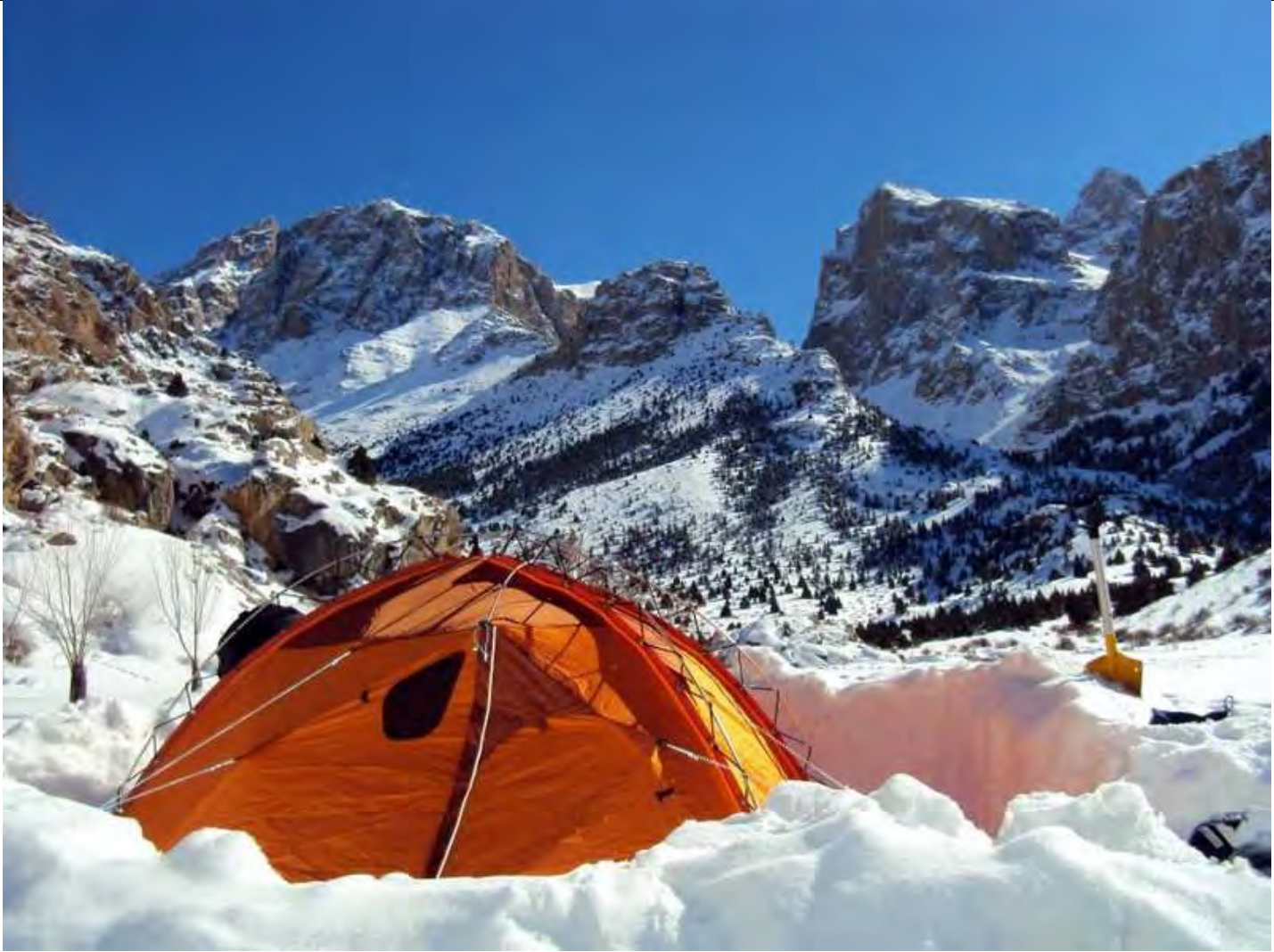
Resim 13, Kamp ve ünlü bir dağcının tabiriyle “Çoğu insanın evlerinde tablolarını süslerken bizim içinde bulunduğumuz” manzara