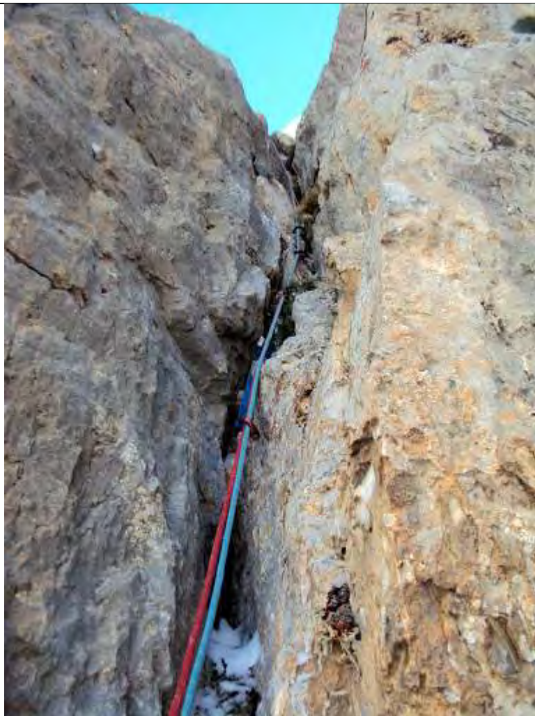
Resim 6, II. İp boyu, baca