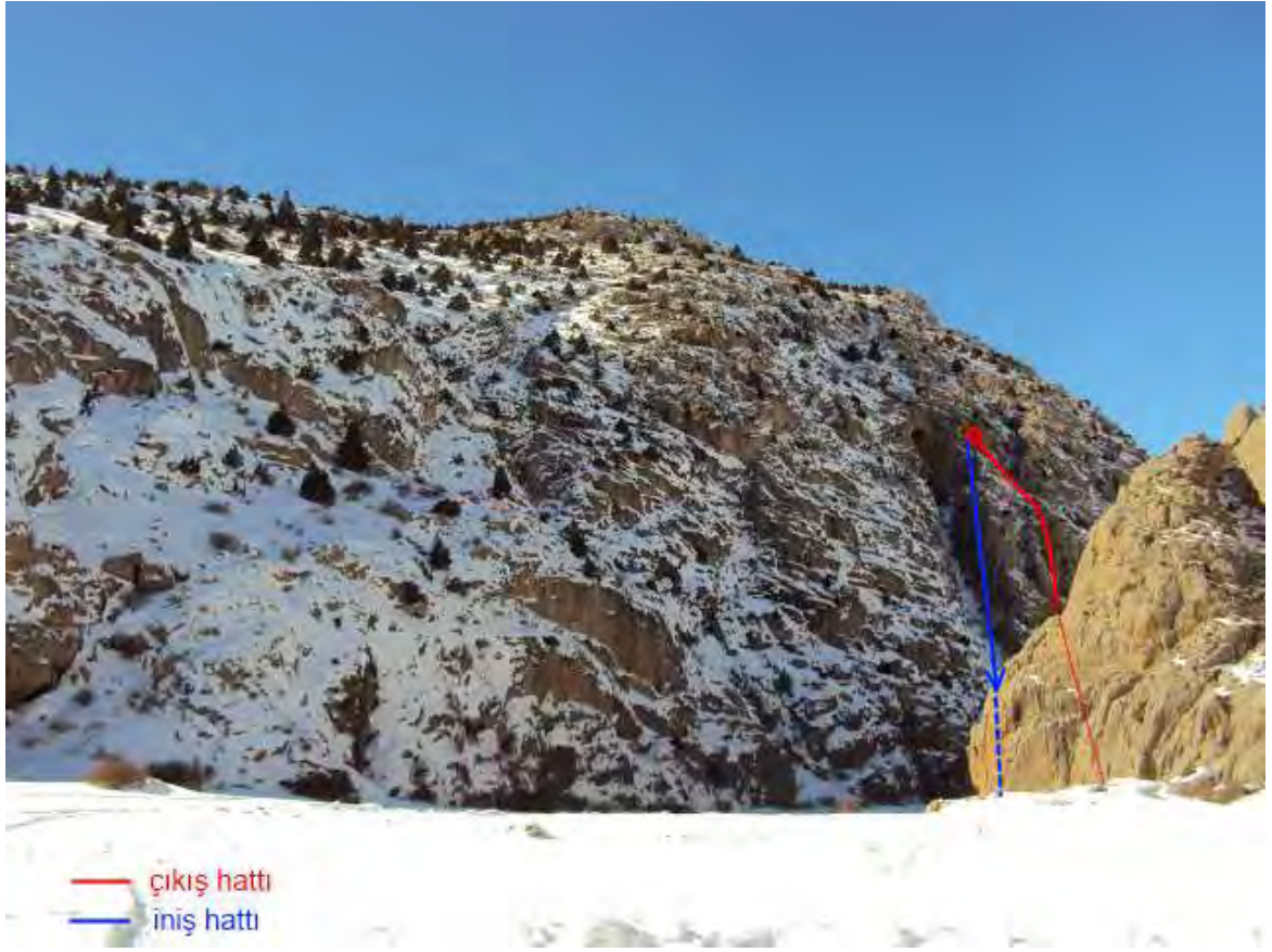
Resim 2, Antrenman için tırmanılan hat