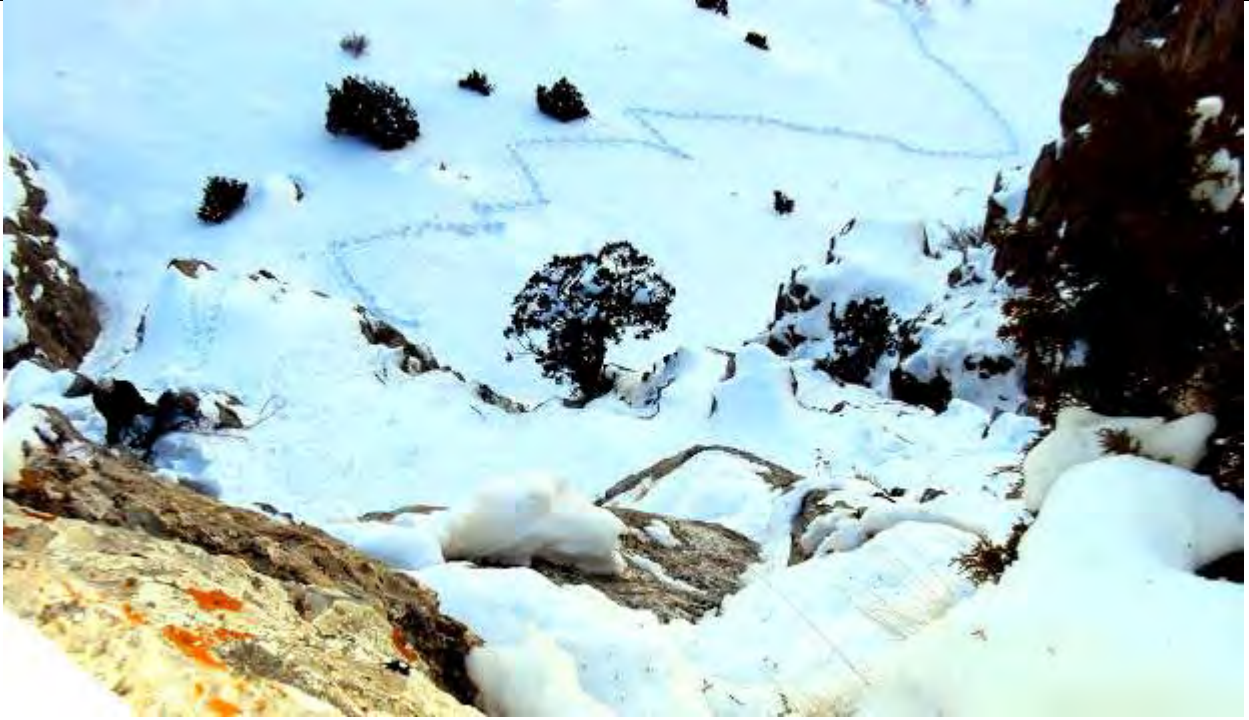
Resim 7, III. İp boyunda, paralel çatlaklar öncesi, aşağıda solda istasyon ve batıdan rotaya yaklaşım izleri