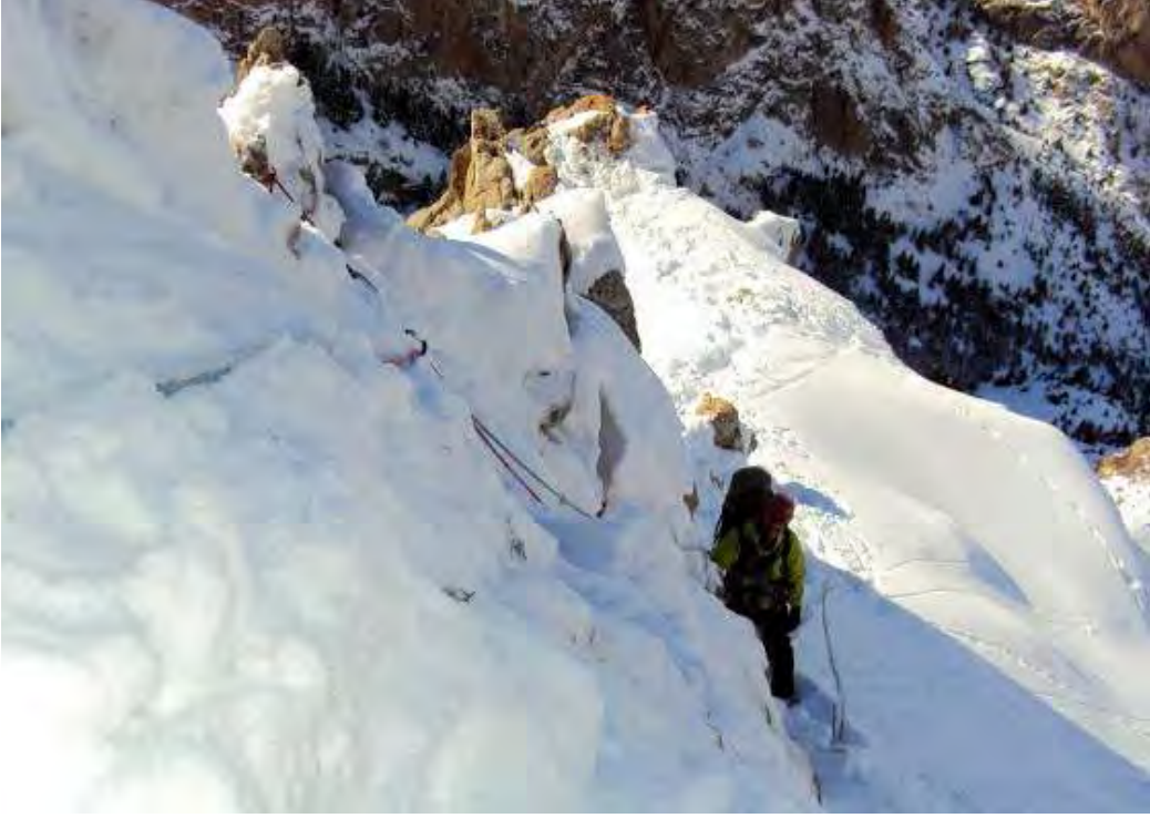
Resim 9, IV. İp boyu, yan geçiş