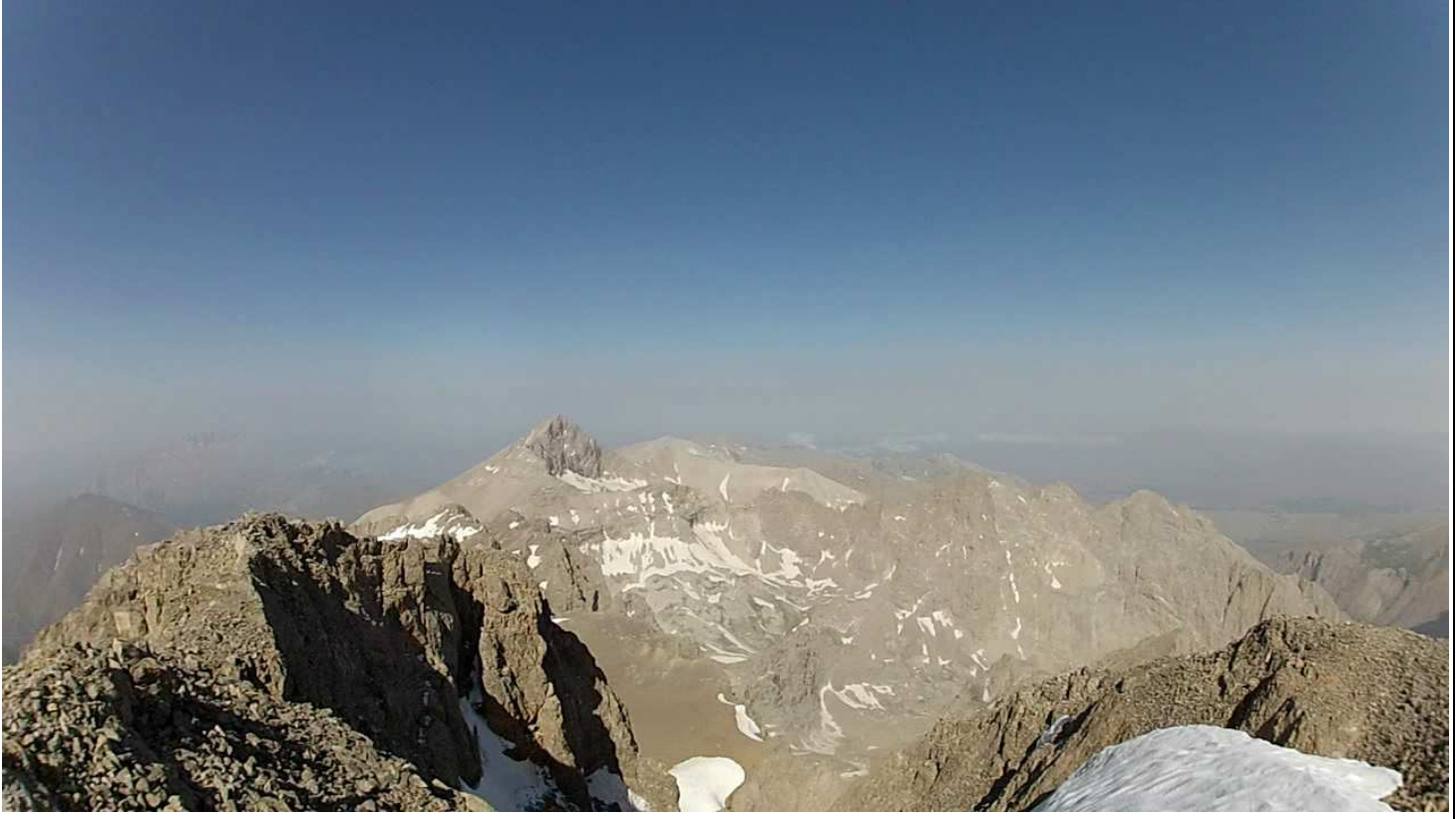
Kaldı zirveden Alaca.