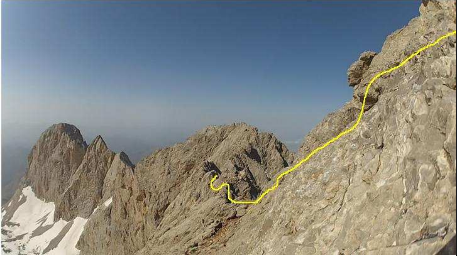
Kaldı Zirvesi sırt geçişi