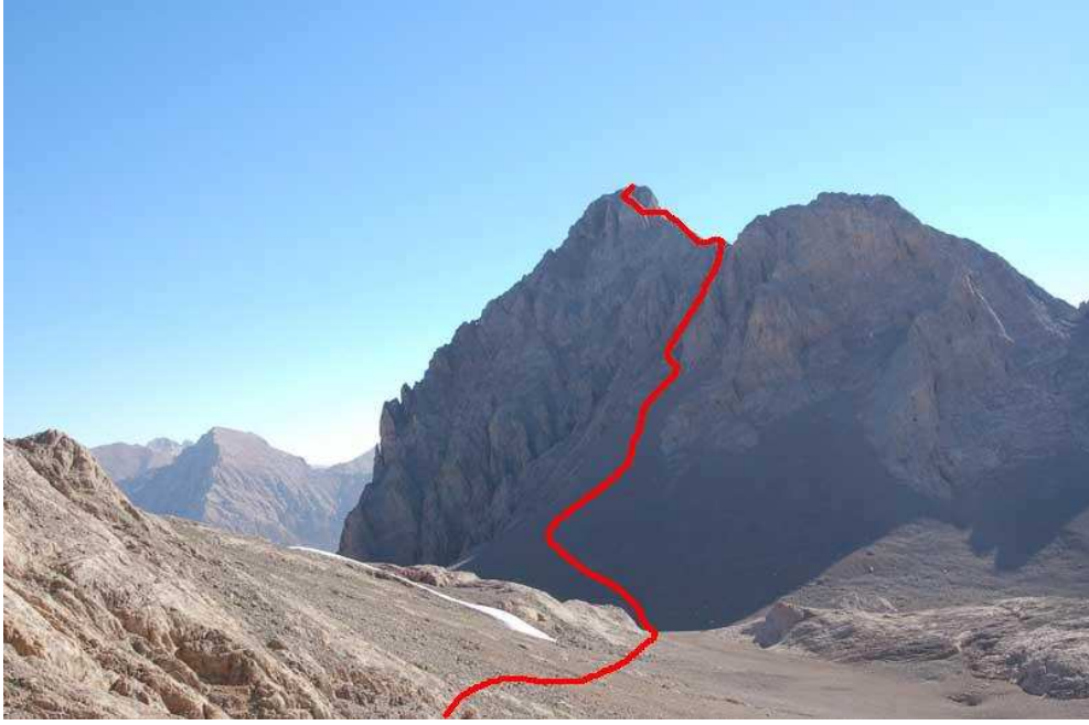
Kaldı Zirvesi Rotası