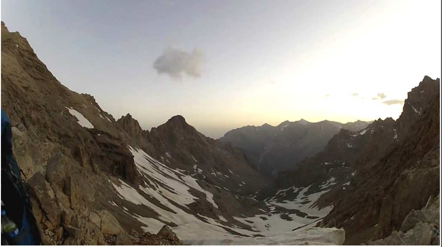
Avcıbelinden Direktaş vadisi