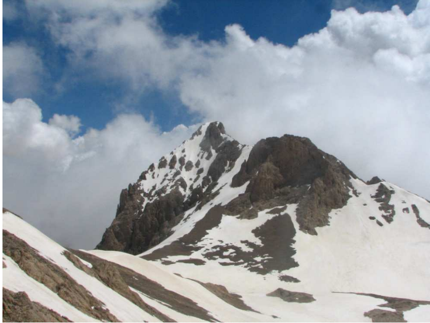
18/19 Haziran 2011 tarihli faaliyetten

Kaldıbaşından bakıldı mı Kaldı ya; insanın içini tarifi zor bir duygu kaplar. Kalan yola bakıp dönmek, zirveye bakıp tüm yorgunluğu unutup gitmek ister insan. Sanırım Efenin Kaldıbaşından ona Kaldıyı gösterdiğimde, aklımdan geçenler böyleydi.