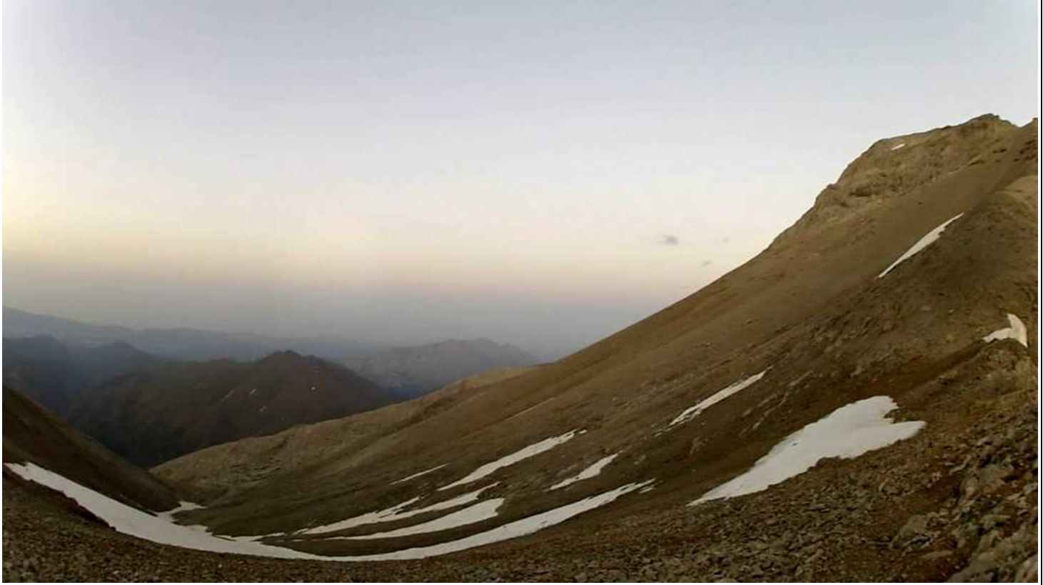
Avcıbeli . Sırttan görünüm. Sağda Alaca.