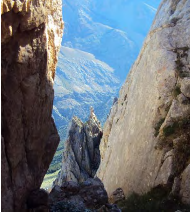
İki hafta önce tepesinde kaldığımız kulenin çentikten görünümü

.Biraz soluklandıktan sonra 05:35'te rotaya girdik.III+,IV- bölümleri serbest geçtik.yaklaşık 70 mt.Daha sonra serbest geçmenin sıkıntı yapacağını düşündüğümüz yerde ip açtık 55 mt IV+ derece bu ip boyu sonrasında II,III derece ile sırtın en basındaki çıkıntıya vardık.Burada birisi perlon bıraktığı için 7-8 mt'lik dik yeri ip inişi yaparak indik (08:15)