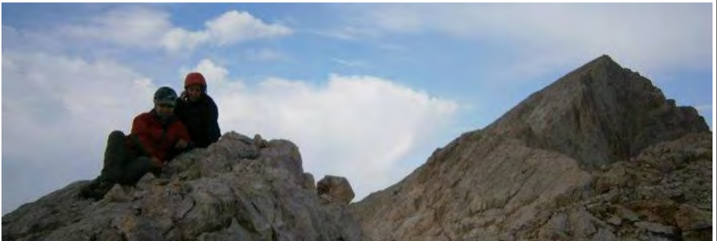
Alaca Hatırası (sağda Alaca solda biz)

Saat 16:00'da orada olması gerekirken 14:30'da Salim Abinin jipini görmek yüzümüzü güldüren bir diğer şey oldu. Biz araca yerleşirken fondaki gökgürültüsü sesleri artmakta, şimşekler çaktıyordu.