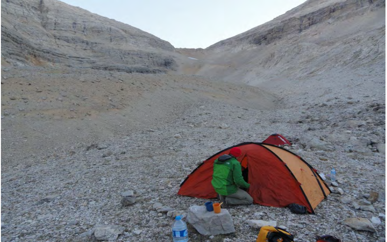
KAMP YERİ - EN ÜSTTE ORTADA AVCI BELİ GEÇİDİ