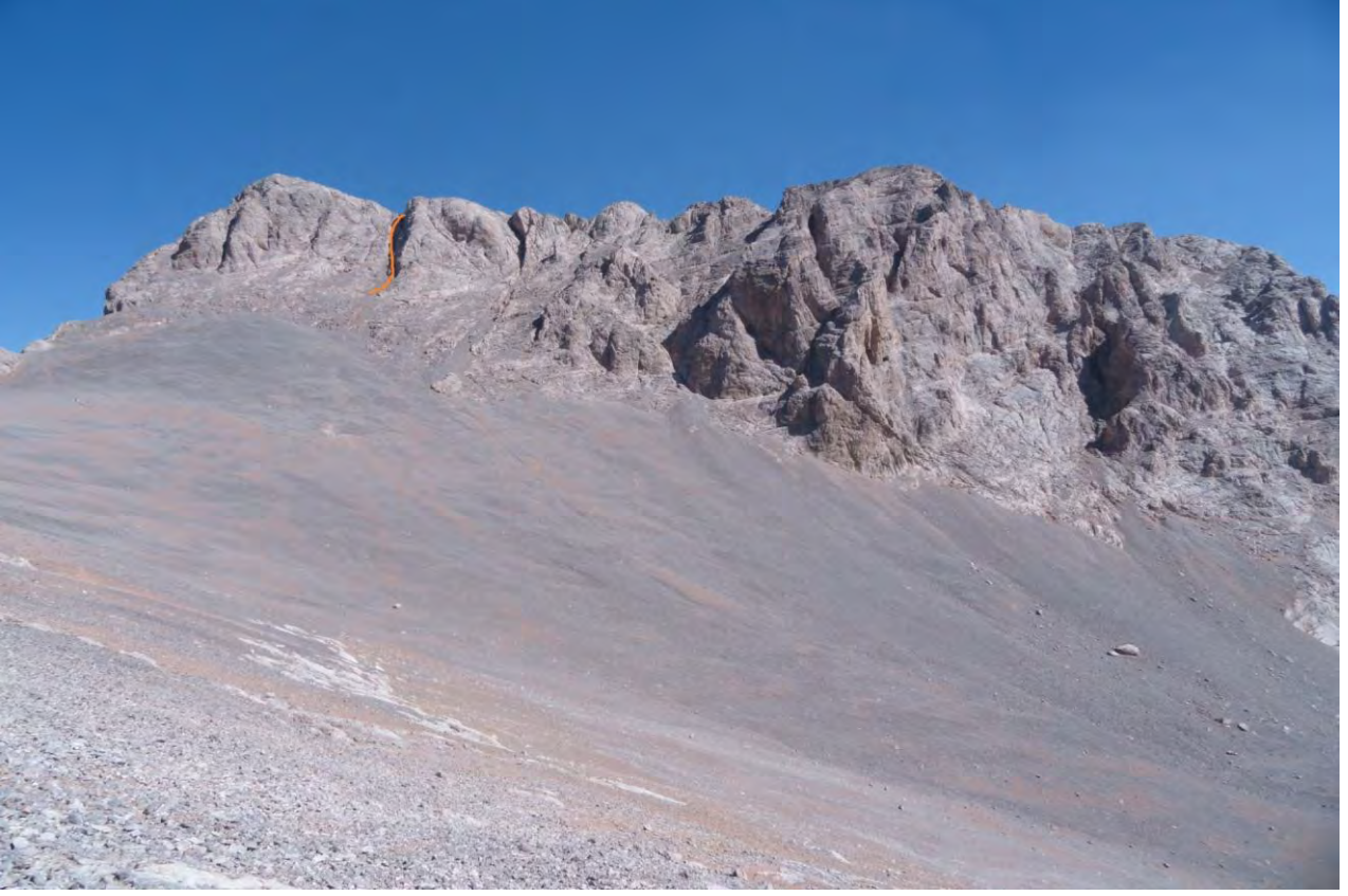
YONCALITAŞIN GÜNEY DOĞUSUNDAN KALDIBAŞI