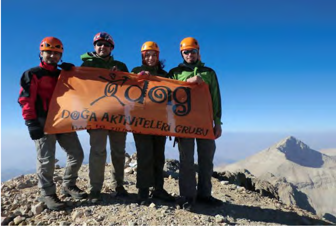
KALDI ZİRVE - 30 EYLÜL 2012 - SAĞDA ALACA