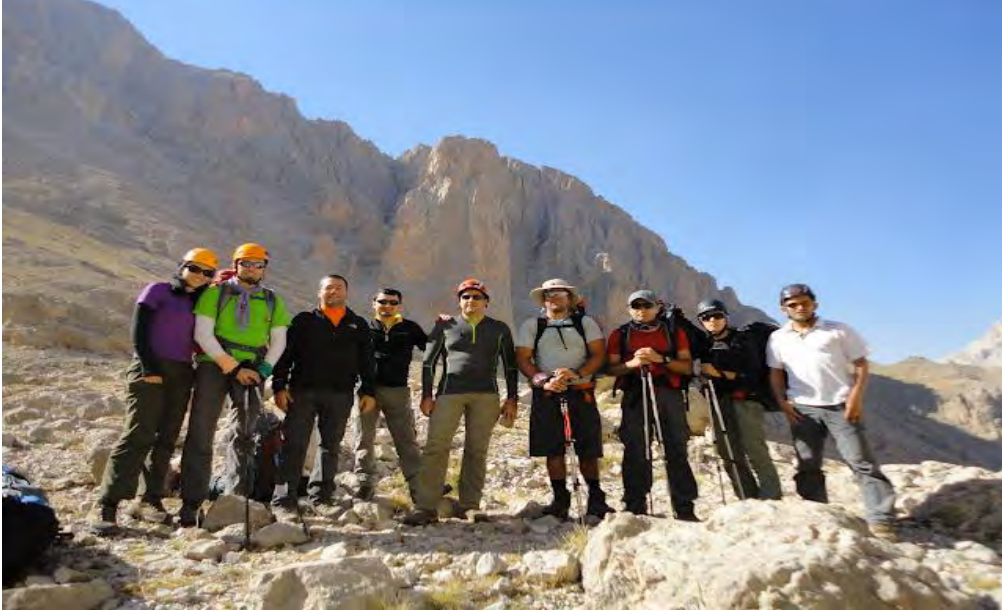
DAG VE ZİRVE DAĞCILIK EKİPLERİ - KALDI KLASİK FAALİYETİ - ALADAĞLAR