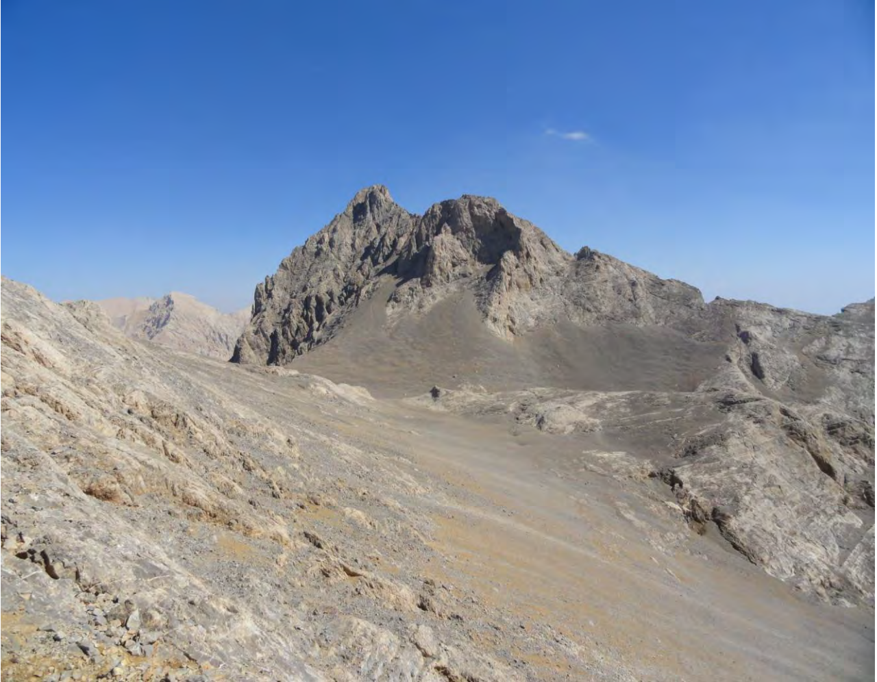
KALDIBAŞINDAN İNERKEN, ALTTA TOP SAHASI VE KARŞIDA KALDI

NOT: Faaliyet öncesi İlçe Jandarma Karakoluna Faaliyet Bildirimi Yapılmalıdır : 0 388 711 24 66