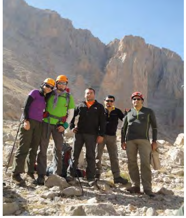
DAG KALDI EKİBİ 29-30 EYLÜL 2012