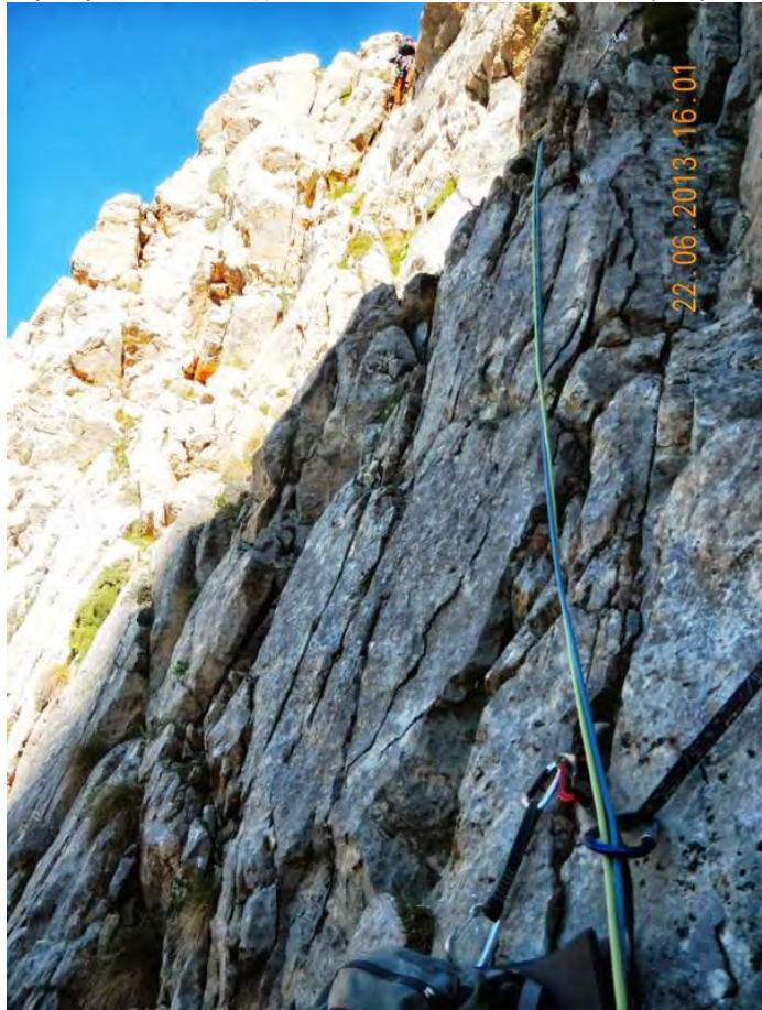
1. İp boyu

1. İp Boyu (IV 60 metre) (Bas 15:50 – Bit 16:50) : Rotanın ilk ip boyu sola doğru yay cizen bir hat şeklinde IV derece emniyeti bol.