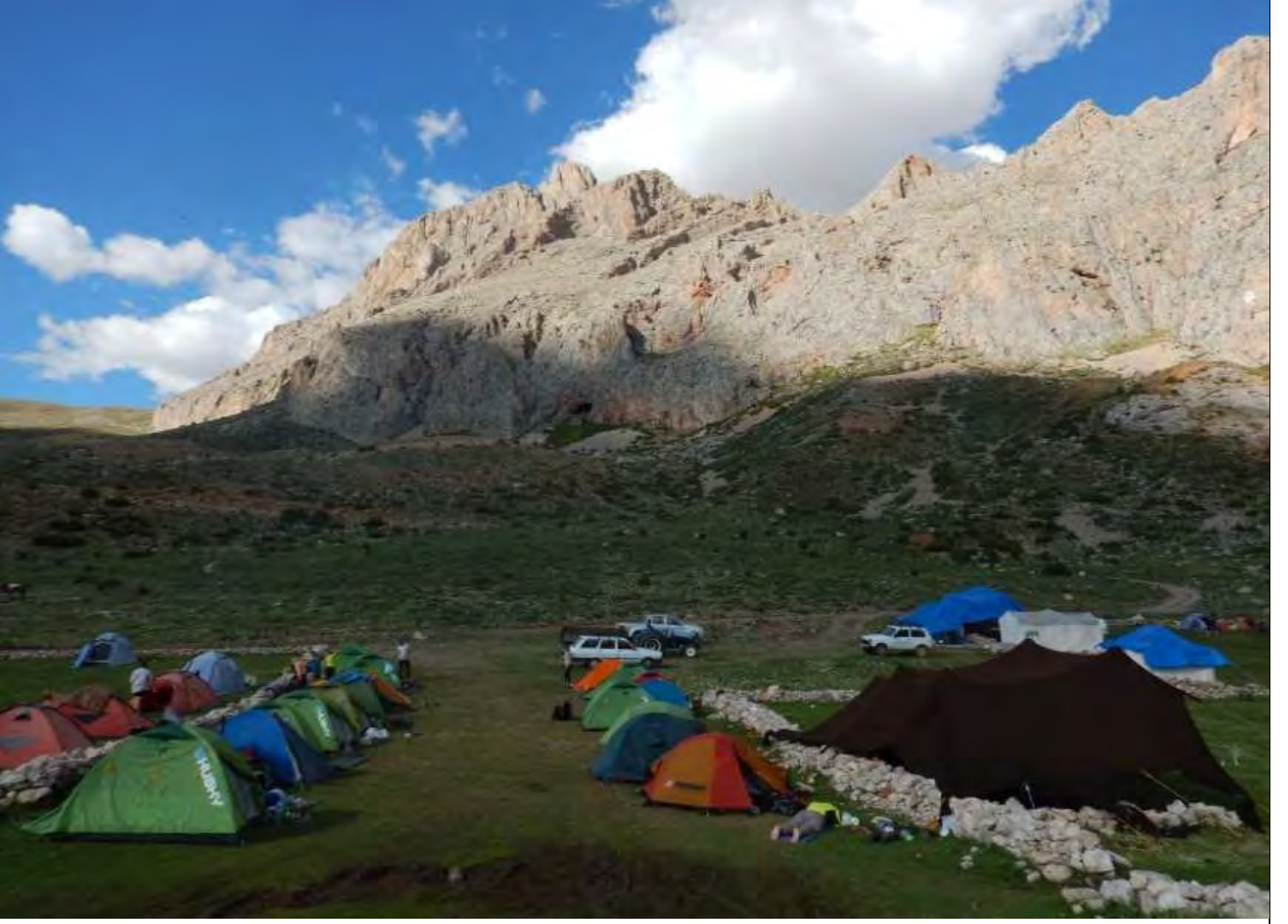
SOKULLU PINARI KAMP ALANI

Tam da bu şekilde gece 11:45 civarı kalkıp yola koyulmak üzere hazırдық. Bu yürüyüşün diğer bir güzelliği ise dolunay eşliğinde yürümektir. Hazırдық ve akşamdan hazırladığımız zirve çantalarımızı alarak yola koyulduk. Dolunay sayesinde kafa lambası kullanmaya bile çok gerek kalmadı. Önündekinin ayak adımlarını rahatça takip edebiliyordun. Kamptan güneye doğru giderek ve Karayalak denen vadiye girdik. Buraya "Kapı" da deniyor, dar bir giriş olduğu için sanırım ☺ Kapının olduğu yer 2600 metreydi.. Aralarda 5'şer dakikalık su, atıştırma ve nefes düzenleme molaları vererek kapıyı geçip Karayalak vadisi boyunca yürümeye devam ettik. Giderek yükseliyorduk. Çelikbuyduran kamp yerinin az aşağısındaki çanakta (3200 mt civarı) (Sobek'in kamp kurduğu alan) üşümekten enerjim iyice azalmıştı ve ekiple yola devam etmemeye karar verdim. Ekibin dönüşünü orada bekleyecektim. Ekiple yürümeye devam eden arkadaşlardan Evren'nin tuttuğu bilgiler ışığında rapora Evren'le birlikte devam ediyor olacağız ☺