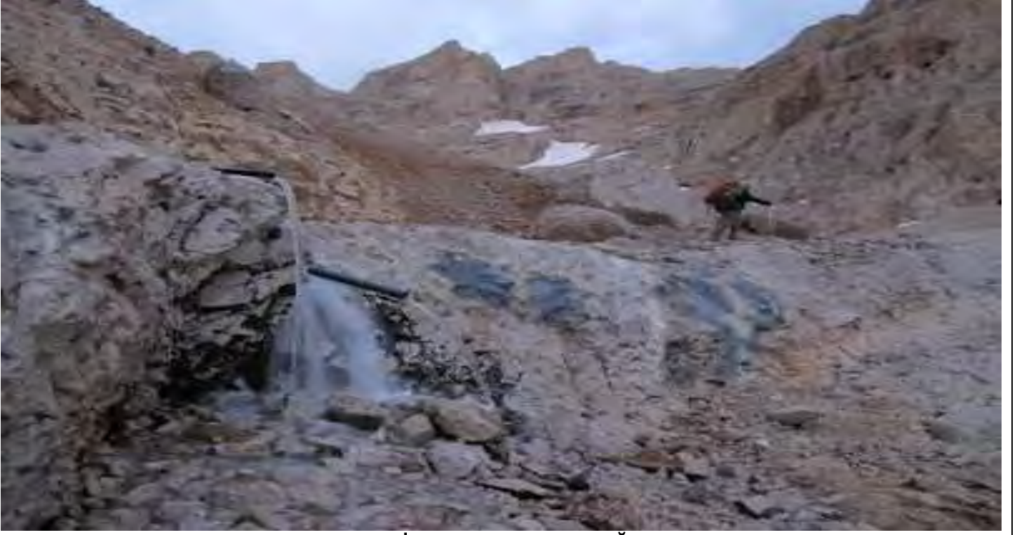
ÇELİKBUYDURAN SU KAYNAĞI

Çelikbuyduran kamp alanı molasından sonra zirveye yürüyüşümüz devam etti ve 07:00-07:30 arasında tüm ekip zirveye ulaştık. Resimden de anlaşılacağı üzere zirvede kar vardı.