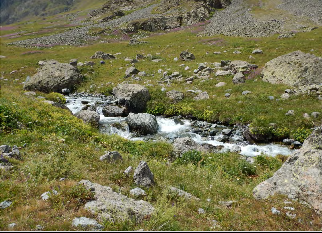
Olgunlar'dan Dilberdüzü'ne Heveg Vadisi boyunca akan Heveg deresi

vadi içerisinde sağımızda akan Heveg Deresi boyunca sürdü. Yürüyüşte Dilberdüzü'nden önce Nastaf yaylasına varıyorsunuz.(2375mt) Nastaftan sonra küçük bir kayalık geçmeniz gerekiyor. Yolda son çeşme Nastafta bulunuyor. Nastafta yaklaşık 30 civarında taş ev var ama kullanılmıyor durumdadır. Buradan sonra yol eğim kazanıyor ve Dilberdüzü'ne yaklaştıkça eğim artıyor.