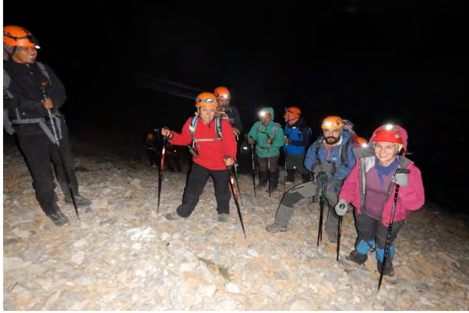
Yan geçişten kareler...