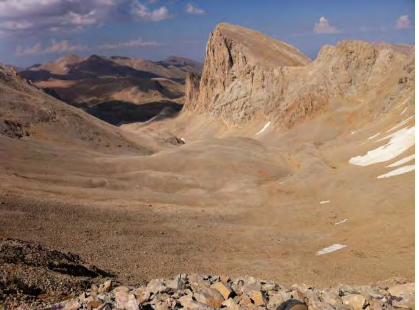
Resim 15, Önce tabanına inip sonra batıya yönelerek yükseldiğimiz vadi.Karşıda batı duvarı görülen zirve Tekekalesinin kuzeyinde, adsız bir zirve. Akçay geçidini neredeyse tam olarak Doğu-Batı istikametinde.