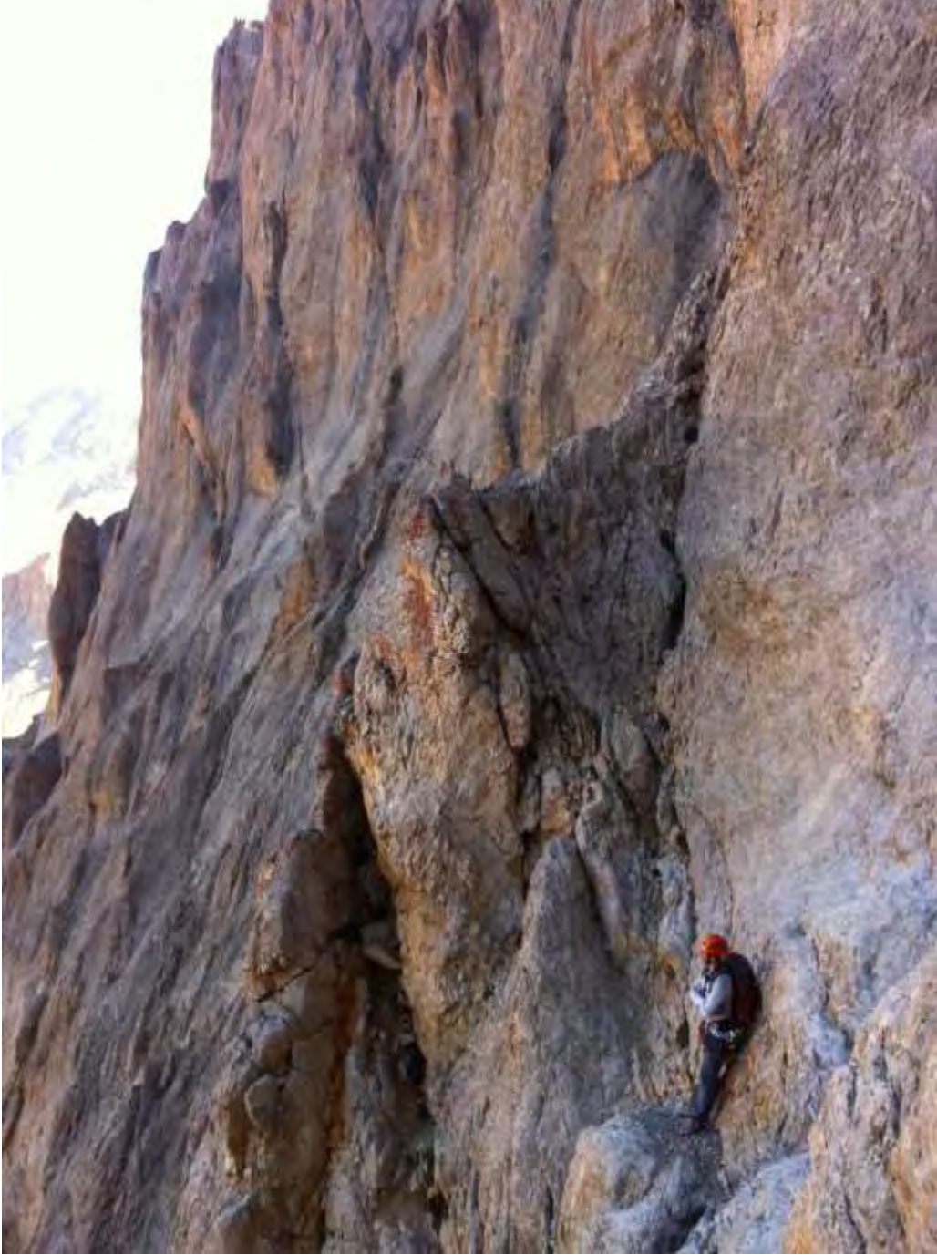
Resim 4, Yan geçişte beklerken. Godot ?

Sarı kulenin altından birkaç mt sağa yan geçip, 10mt kadar sete iniş ve sağda görülen bariz bacanın altına kadar yan geçiş.