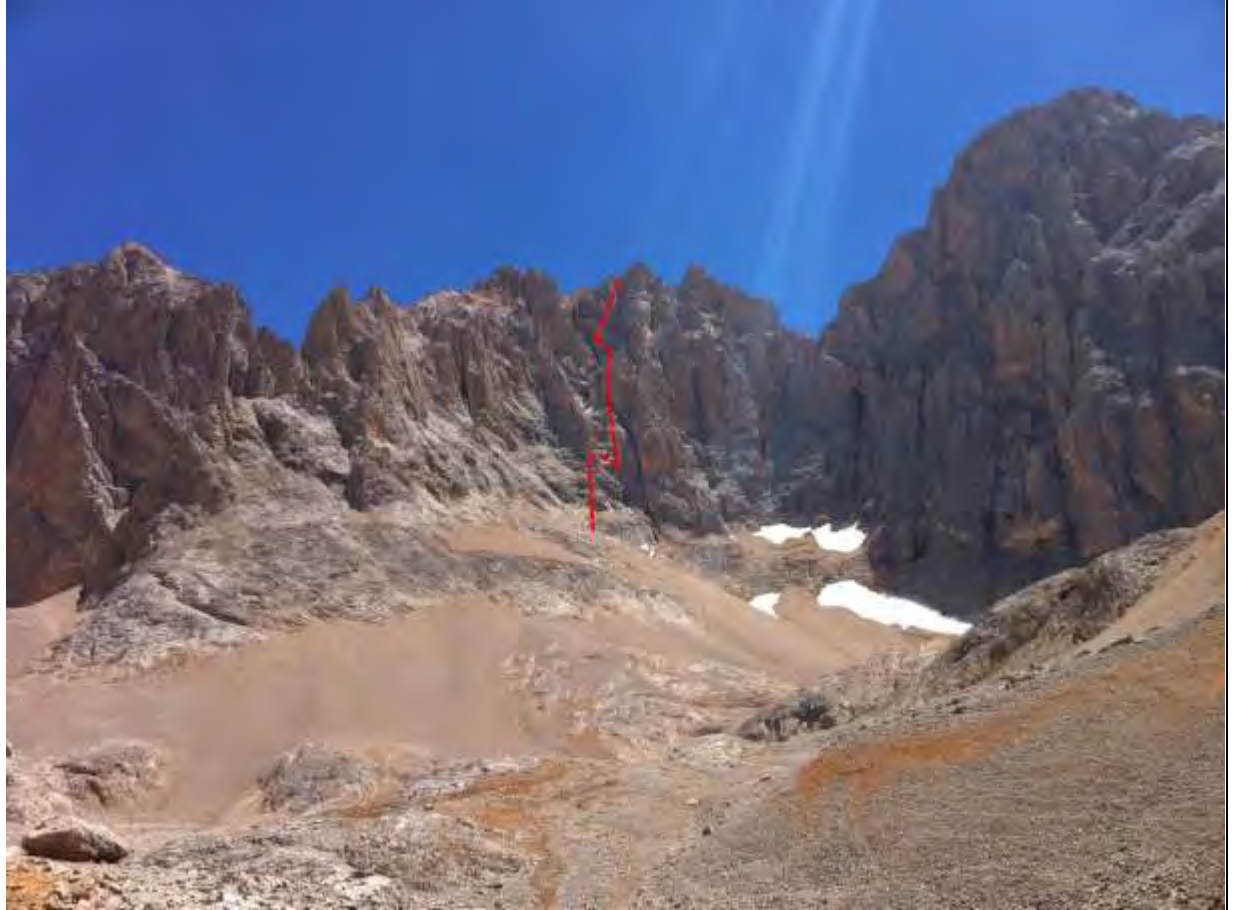
Resim 2 , Sağda Kocasarp, solda Beşparmak zirversi ve tahmini olarak tırmanılan hat –tırmanış için referans alınmamalı--