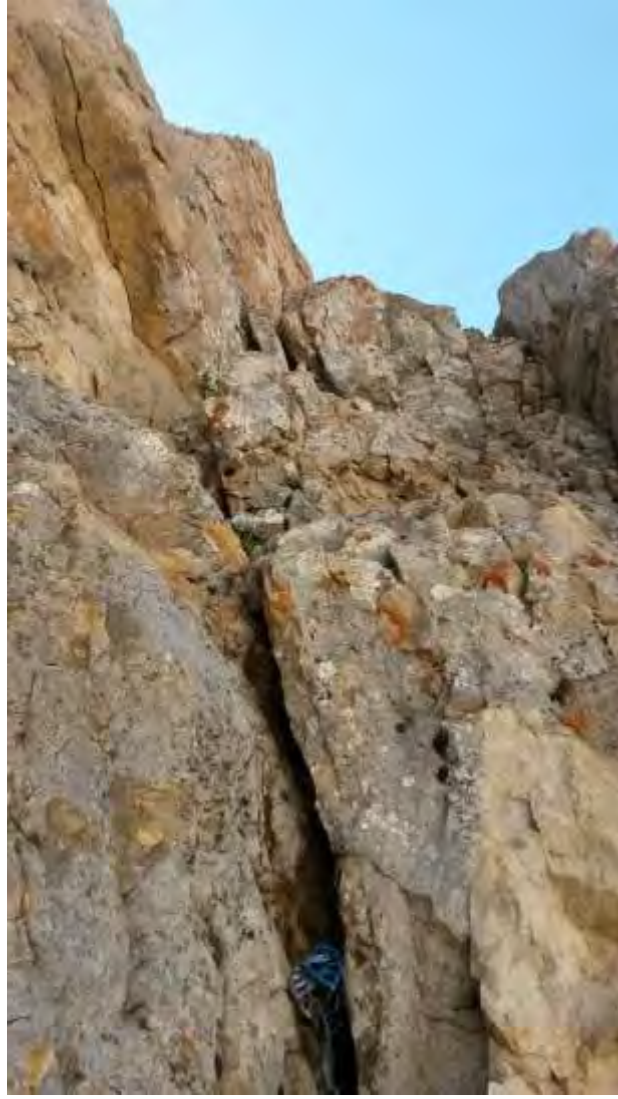
Resim 9, 8.ip boyu başlangıcı