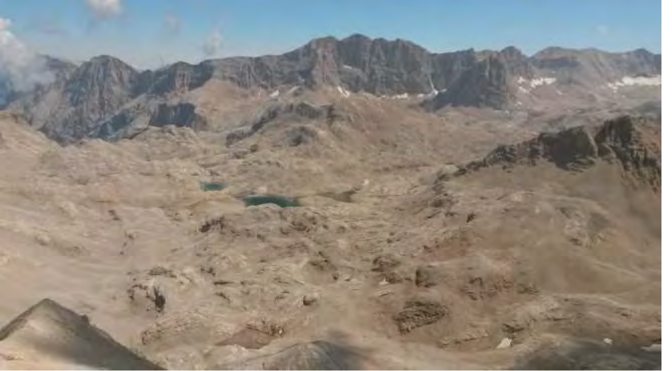
Resim 14, Zirveden Hacer boğazi, Hastahocanın yaylası, Direktaş