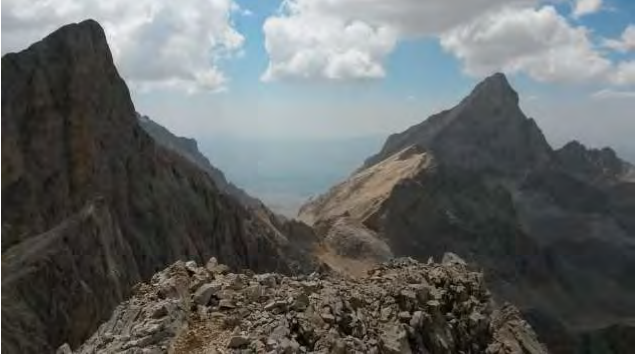
Resim 13, Zirveden Kocasarp Kuzey ve BDK Doğu & klasik yüzleri