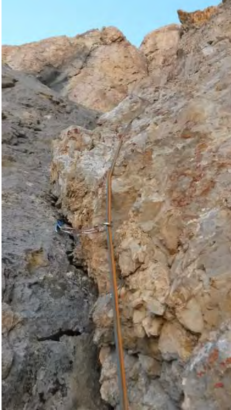
Resim 5, 4.ip boyu başlangıç etapları

30mt kadar görünen istikrarlı çatlak sol yüzey gri ve başlangıçta bol tutamaklı, sağ yüzey ise sarı ve girişte hafif çürük görünen etabın ilk 10-15mt'si kolay (V-V+). Devamında ise çatlak inceliyor emniyet imkanı vermediğinden, Yahya sarı ve dik yüzeyden atletik ve sert boulder hamleleriyle 2-3mt sağa yükselip sonra sola geçerek emniyet imkanının azaldığı gri yüzeydeki küçük sette bıçak sikke ile zor bir ara emniyet atıyor. Sola hamle yaparken basamaklar arası mesafe açık olduğu için dinamik bir şekilde ayaklarını taşıyor, bense neredeyse limitimde, statik olarak uzanıyorum. İyi tutamaklı ama ayaksız yüzeyden, devamında yer yer açık tutuşlarla yükselip 1-2mt sola çapraz yükselerek küçük sete çıkıyoruz. Burada ip inişi yapıldığını düşündüğümüz sikkeye takılı bir perlon buluyoruz. Birkaç mt yukarısında askı istasyon kurup, universal, yumuşak bir sikkeyi bizim gibi yolunu şaşırınlar için bırakıyoruz.