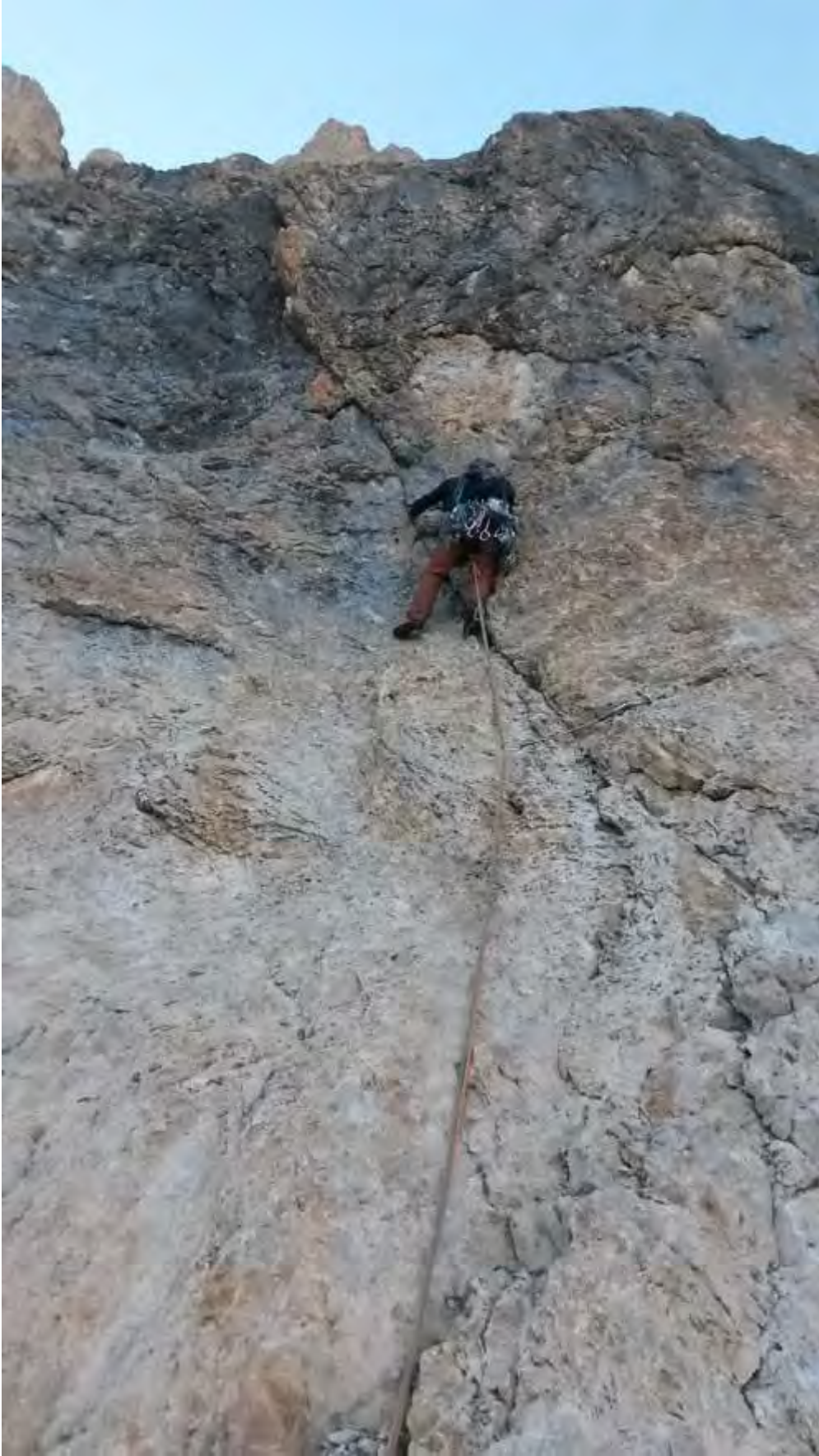
Resim 3, 1.ip boyu girişi ve zor kısımların bağlangıcı