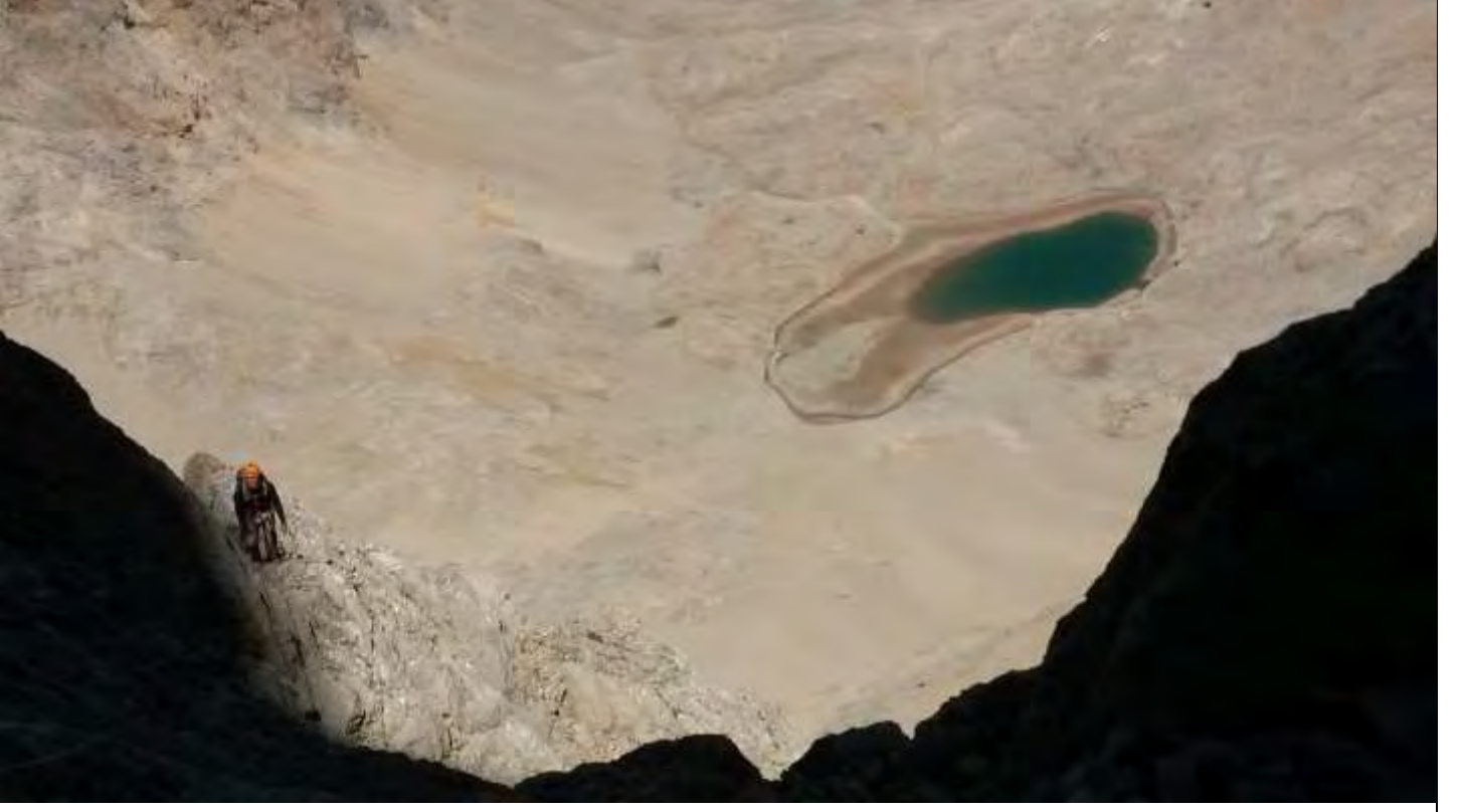
Resim 8, 5.ip boyu istasyonundan Dipsiz Göl manzarası

Geniş çatkallı, yer yer oynayan kayaların olduğu hattan 15mt kadar yükselip sola çapraz yükselerek ~1mt çap ve yüksekliğinde babanın yanında istasyon.