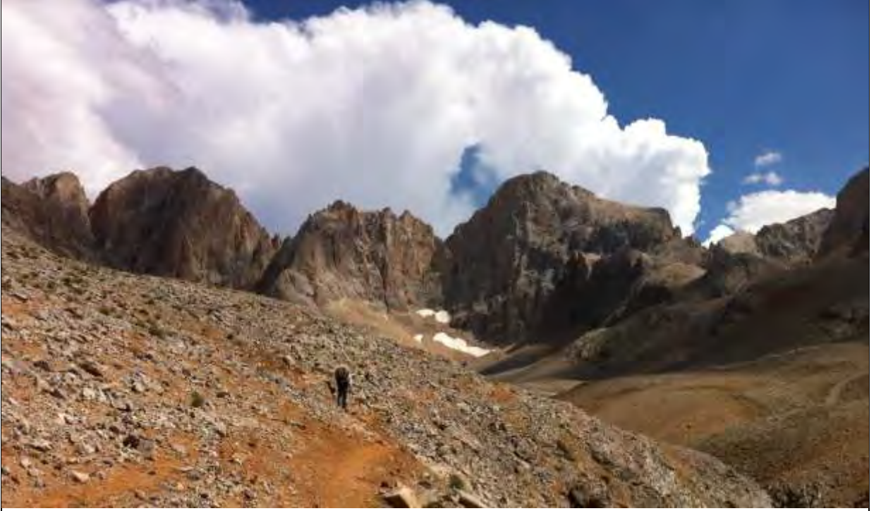
Resim 1, Tekepinarı patikasından soldan sağa Cağalınbaşı, Beşparmak, Kocasarp