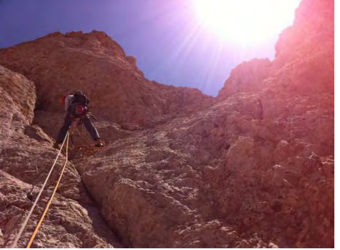
Resim 10, 8.ip boyu sonunda yarı askı istasyon, zirvenin hemen altı