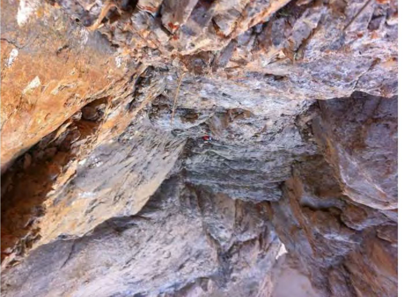
Resim 7, Askı istasyondan 4.ip boyu