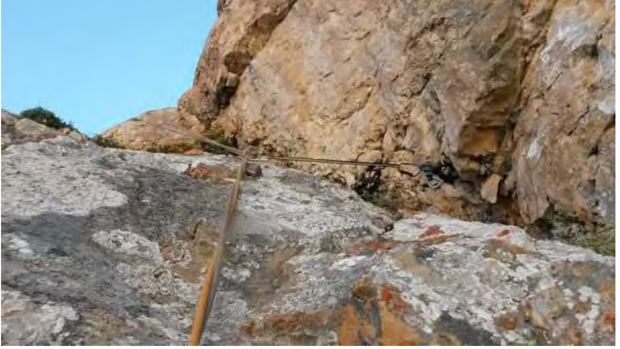
Resim 6, 4. ip boyu, kilit etap sonrası