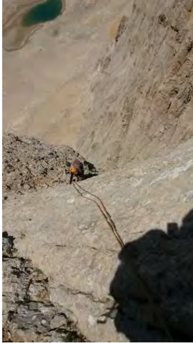
Resim 11, 8.ip boyu sonu ve arkada Dipsiz Göl. Zirvenin altında olduğumuzun farkında değiliz.