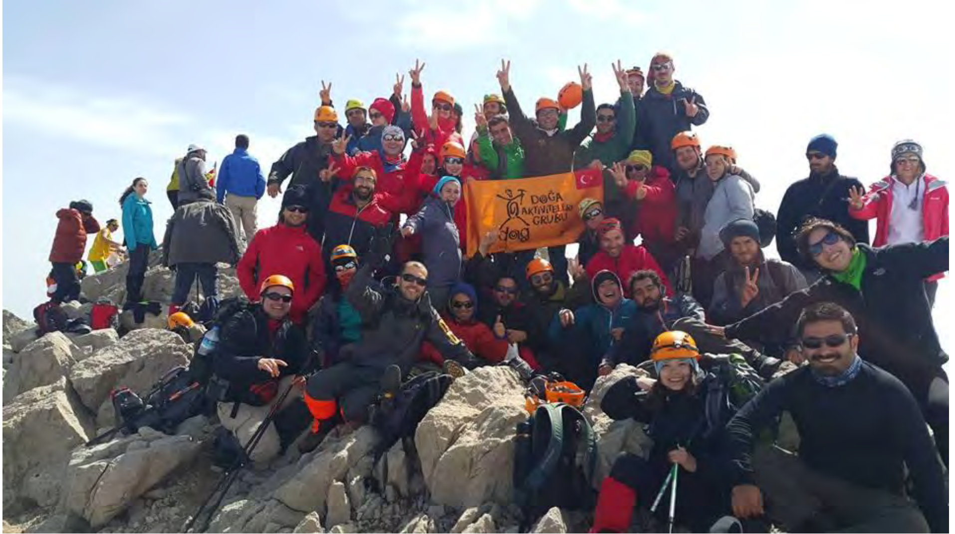
DAG 2015liler olarak Dedegöl Zirvesi'ndeyiz!