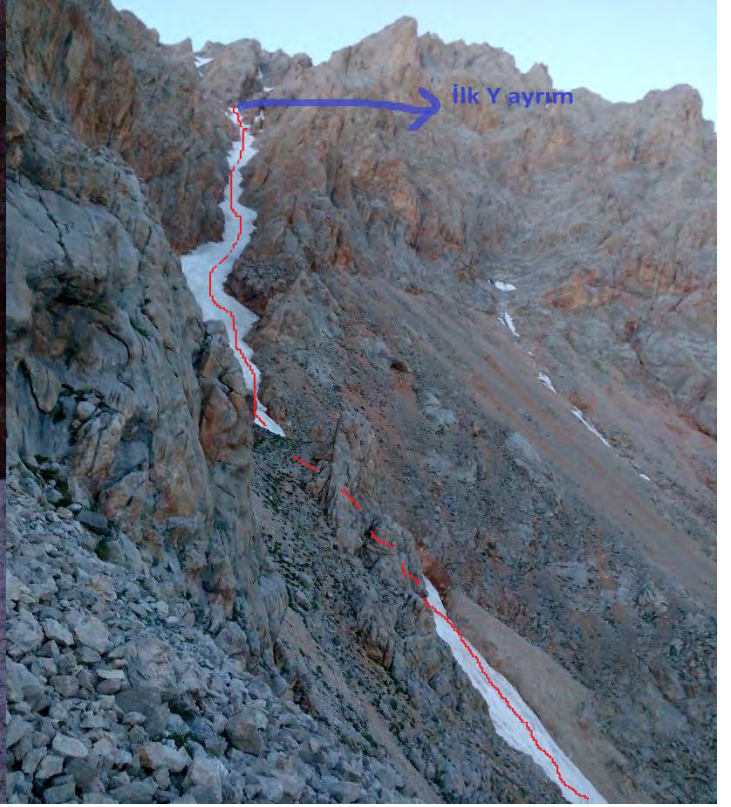
Kulvar girişinden kulvarın devamı ve ilk Y ayrım

İlk Y ayrımından sonra kulvar biraz daralıyor ve kar sertleşiyor , devamında daralan kulvar bitiyor ve anfi tiyatro denen geniş bir alan ve ikinci Y ayrımına ulaşıyor.Burada sağa doğru açılan kulvarlara aldanmayıp geldiğiniz kulvarın devamı olan direk yuarı doğru devam edin.Burayı geçtikten sonra artık yukarı doğru baktığınızda V çentigi görebilirsiniz.