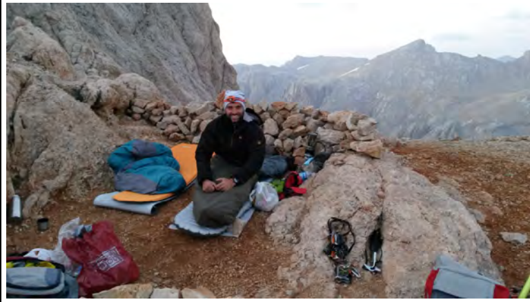
Şekil 1 - Sırttaki bivak alanı çadır atılabilecek kadar geniş (zirveye giden kılçık hattında da bivak yeri var)

Cumartesi 14.00 da Arpalık'tan başladığımız yürüyüşle 16.10 da Obayeri'ne, sonrasında da mevsimlik göle vardık. Mevsimlik göl üstünden kazma krampon takip doğu duvarının dibindeki kar kulvarından çıkarak akşam 19.30 civarında sırttaki bivak atılabilecek alana ulaştık. Kar kulvarı yerine, kulvarın solundaki çarşak yüzeyden de sırta rahatlıkla ulaşılabilir.