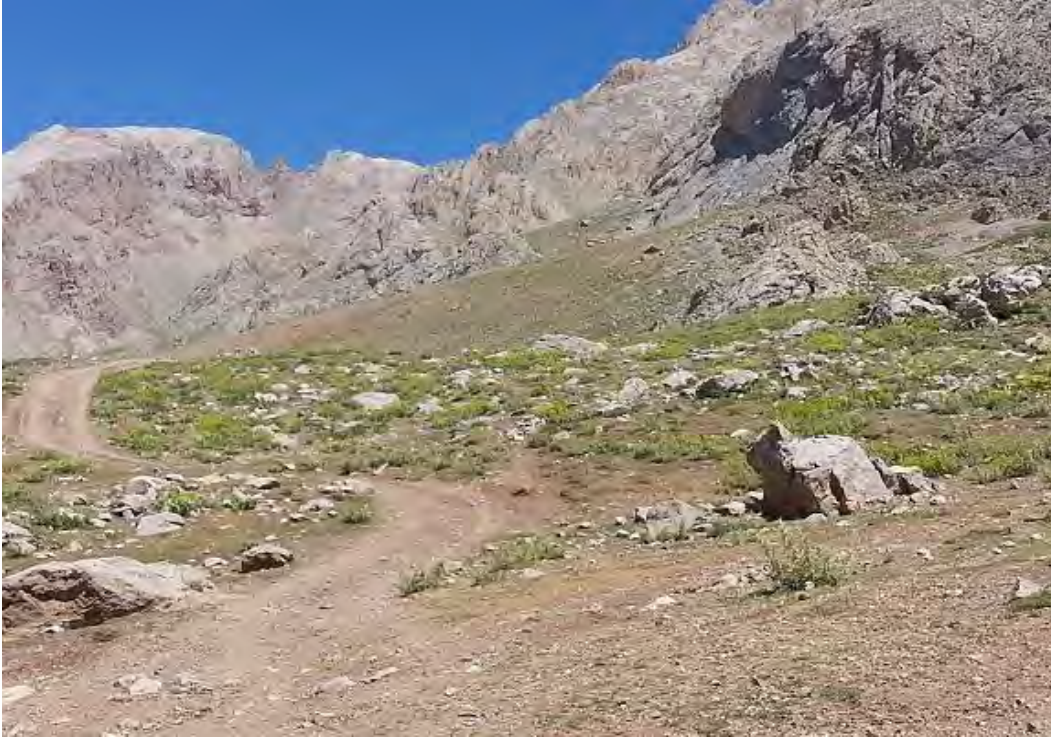
Arpalık Mevkii... Traktörden inip yürümeye başladığımız yer...

Arpalık mevkiinden 1 saatlik yürüyüşle Tekepınarı kamp alanına vardık. Tekepınarındaki su kaynağının olduğu yerde yaklaşık yarım saat mola vererek sularımızı tazeledik.