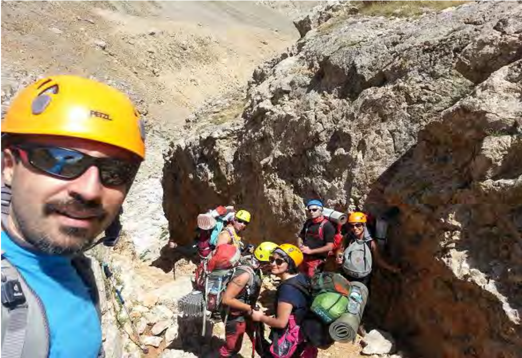
Tekepınarına indiğimiz yer...

Arpalık mevkiinden 1 saatlik yürüyüşle Tekepınarı kamp alanına vardık. Tekepınarındaki su kaynağının olduğu yerde yaklaşık yarım saat mola vererek sularımızı tazeledik.