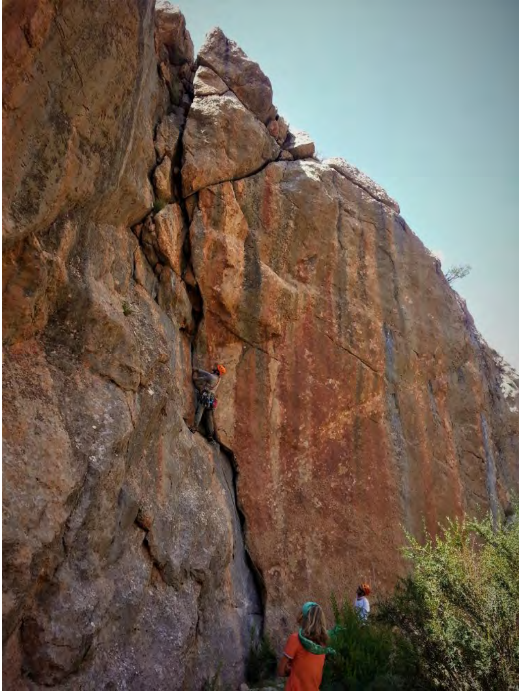
Resim 8, Can Sarımemetlere girerken sağdaki güzel çatlakta (VI, VI+)