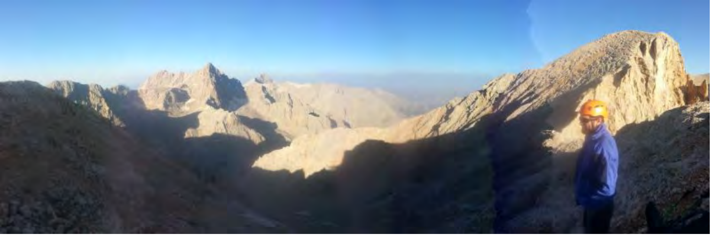
Resim 3, Küçükcebel sonrası, sağda arkada Gürtepe

İkinci gün Küçükcebele klasik patikasını izleyerek (7.25). Güzeller buzul çanağındaki büyük taşların olduğu kısımda patika belirsiz. Acele edip soldan yükselinirse güney/güneybatı yüzündeki farklı bir kulvara girilir (III+ devam edip zirveye bağlanır). Güneydoğu istikametinde, Şeytan rampasını görerek ilerlendiğinde çarşak zeminde sola doğru yükselen patika görülür. Küçükcebel sonrası Cebelbaşına ve arada kısa molalar vererek çok zor olmayan sırt hattını takip ederek Gürtepeye vardık (8.25).