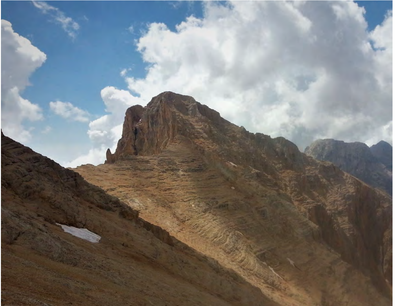
Resim 6, H4 zirvesi altlarından geriye bakınca Gürtepe