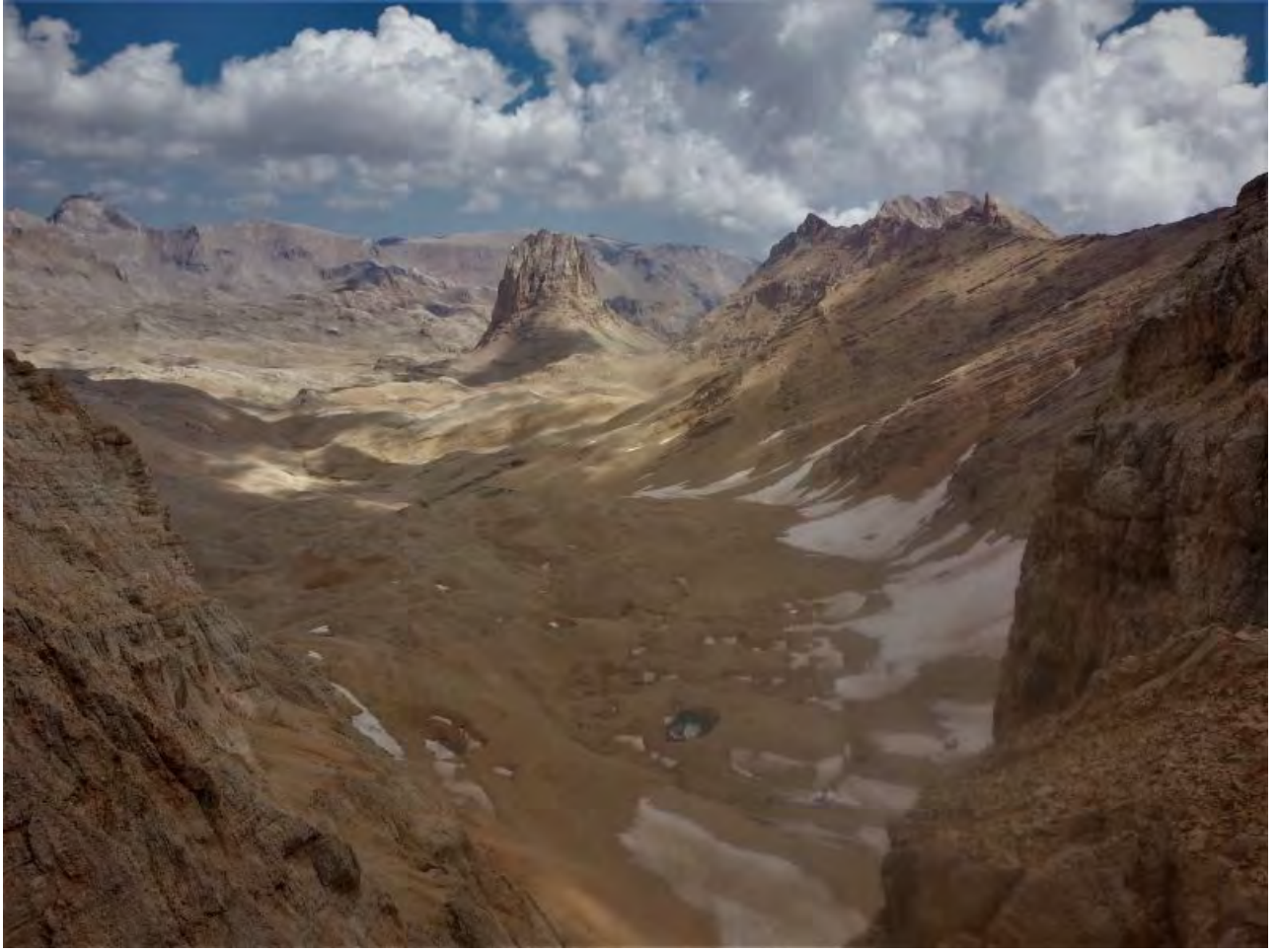
Resim 7, Oksar tepe öncesi sırt hattının alçaldığı noktadan Yedigöller platosu ve Direktaş

Saat 12.30u bulmuş, sabahtan beri biz ilerledikçe Kaldı tarafında biriken bulutlar da bize yaklaşmıştı. Bir süre sonra önce Kaldı kuzeye sonra Lahitkaya'ya yağış düşmeye başladığında rotayı bitiremeyeceğimiz anlayıp iniş kararı aldık. İniş alternatiflerini düşünürken havada artan elektrik yükü nedeniyle cızırtılar duymaya başladık. Hızlı bir değerlendirme ile dönüşü çok uzatacağı için Yedigöller'e iniş alternatifini eleyip, başlangıcı kolay çarşak olan ama devamını göremediğimiz vadiden inmeye karar verdik.