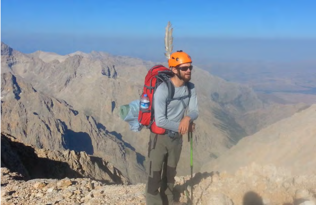
Resim 4, Sırt hattında rastlayabileceğiniz endemic türlerden...

Tarif edilen iniş istasyonunu bulsak da biraz daha alçalıp kuzey yüzündeki setlerden zikzaklar çize çize inip H4 zirveye uzanan sırt hattına bağlandık. Burada çürüklük nedeniyle oldukça vakit kaybettik. H4 sırtına çıktığımızda yaklaşık olarak bir sonraki zirve olan Oksar tepe irtifasında yükselip alçalmadan, H4 zirveyi es geçerek Oksar tepeye vardık.