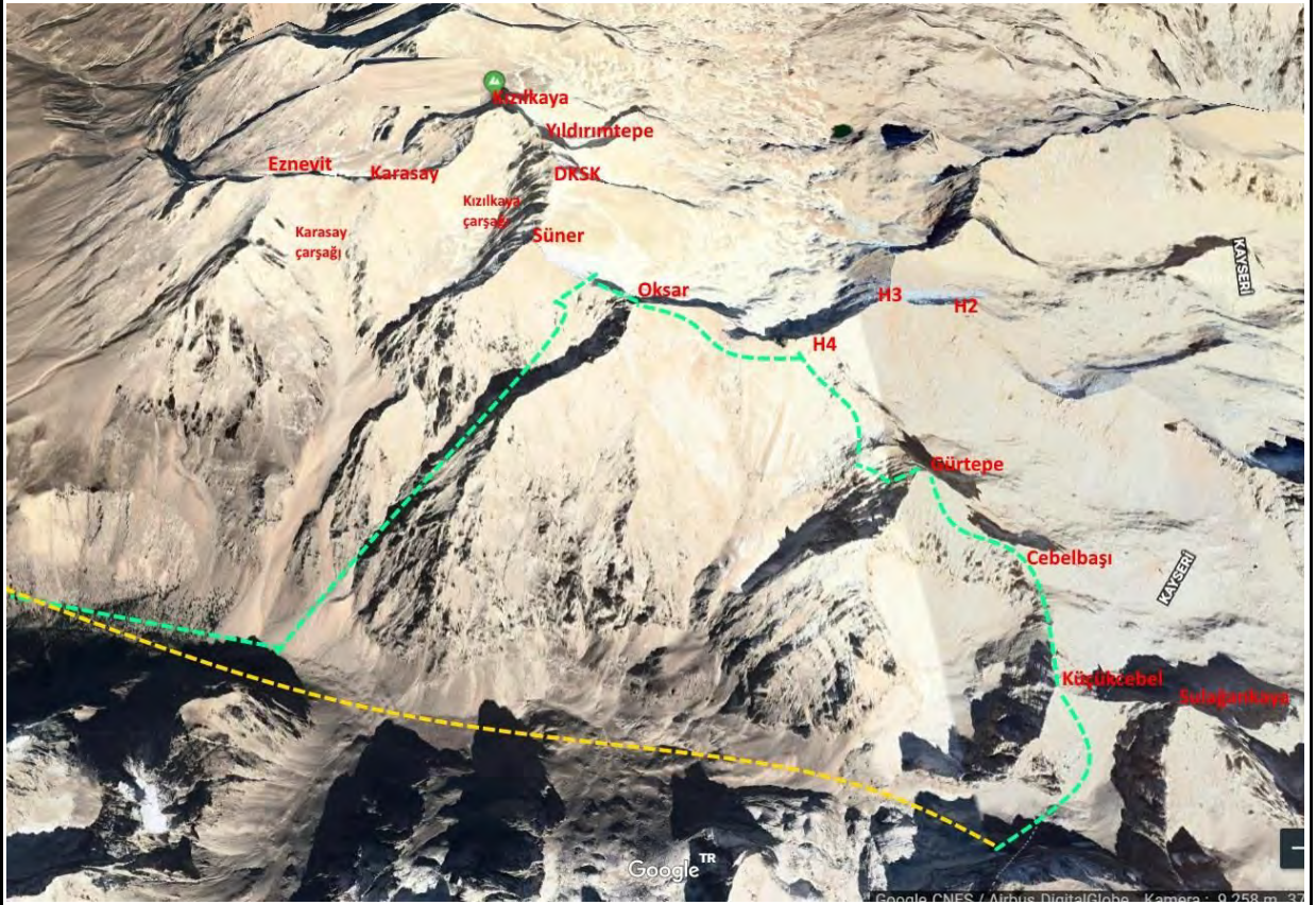
Resim 2, Sarı birinci gün, Yeşil ikinci gün izlediğimiz yol