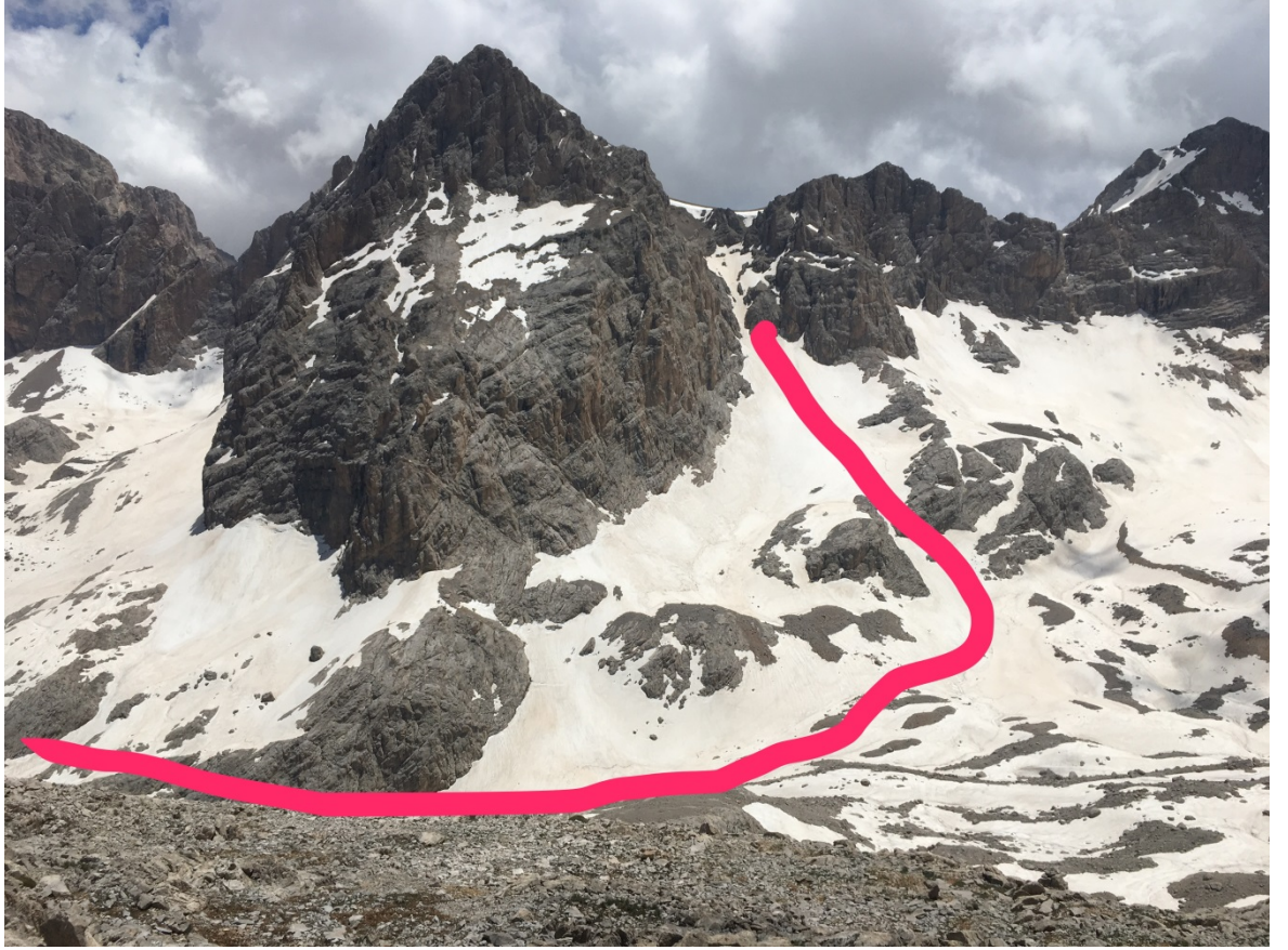
Bizim izlediğimiz rota