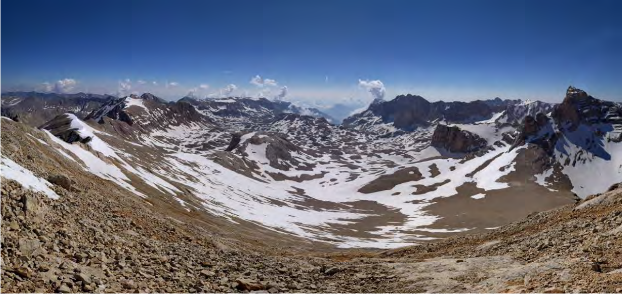
Zirveden Yedigöller platosu