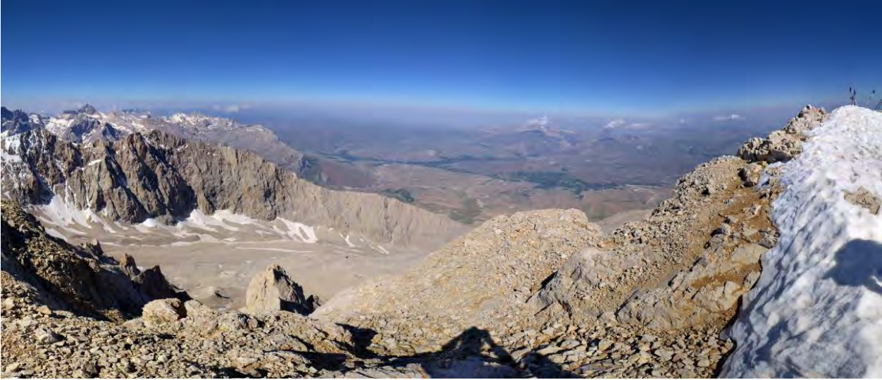
Zirve karlar altında!