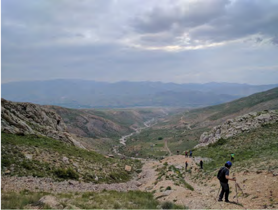
Narpuz Vadisi dönüşü küçük minik tatlı kamp alanımızın uzaktan bir fotoğrafı