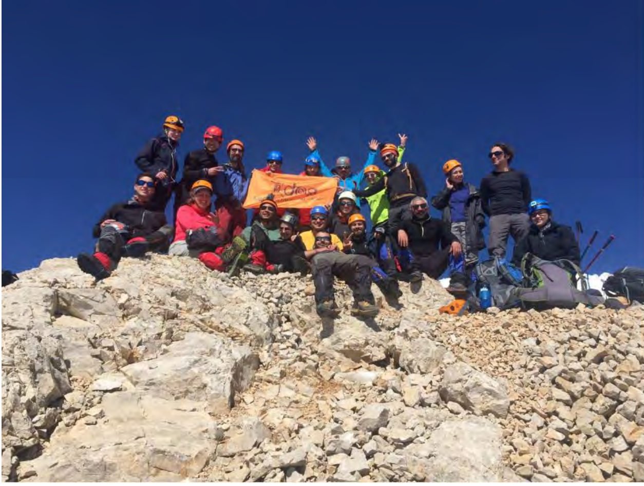
Zirve de bir avuç DAG'lı =).