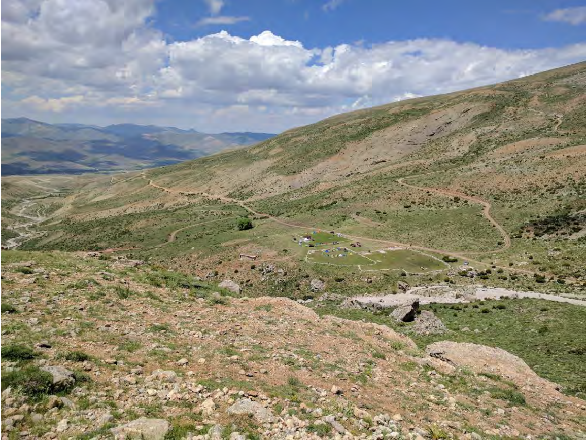
Küçük minik tatlı kamp alanımızın zirve dönüşü görünümü