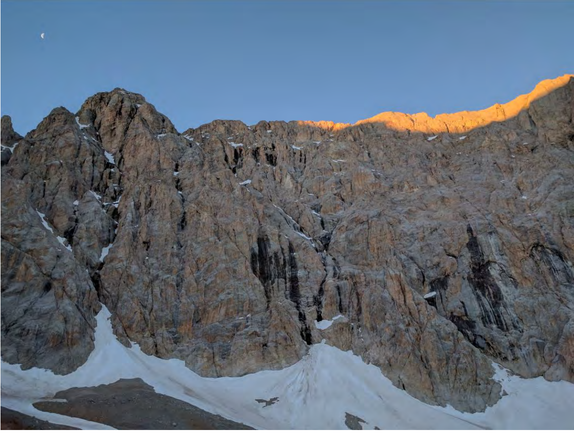
Aladağlar yeni bir güne merhaba diyor!