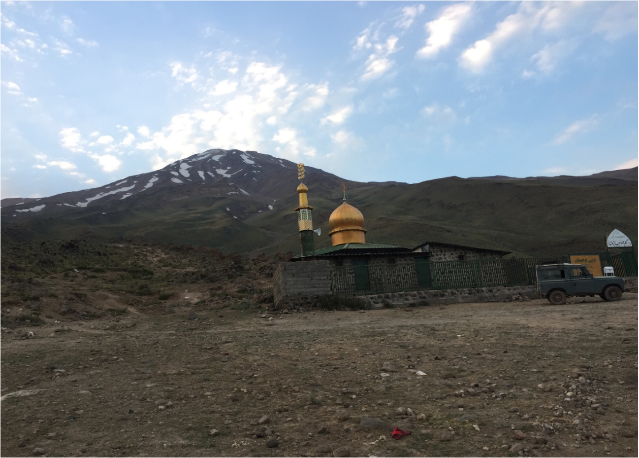
Goosefand Sara – 3050 mt. Camp 2