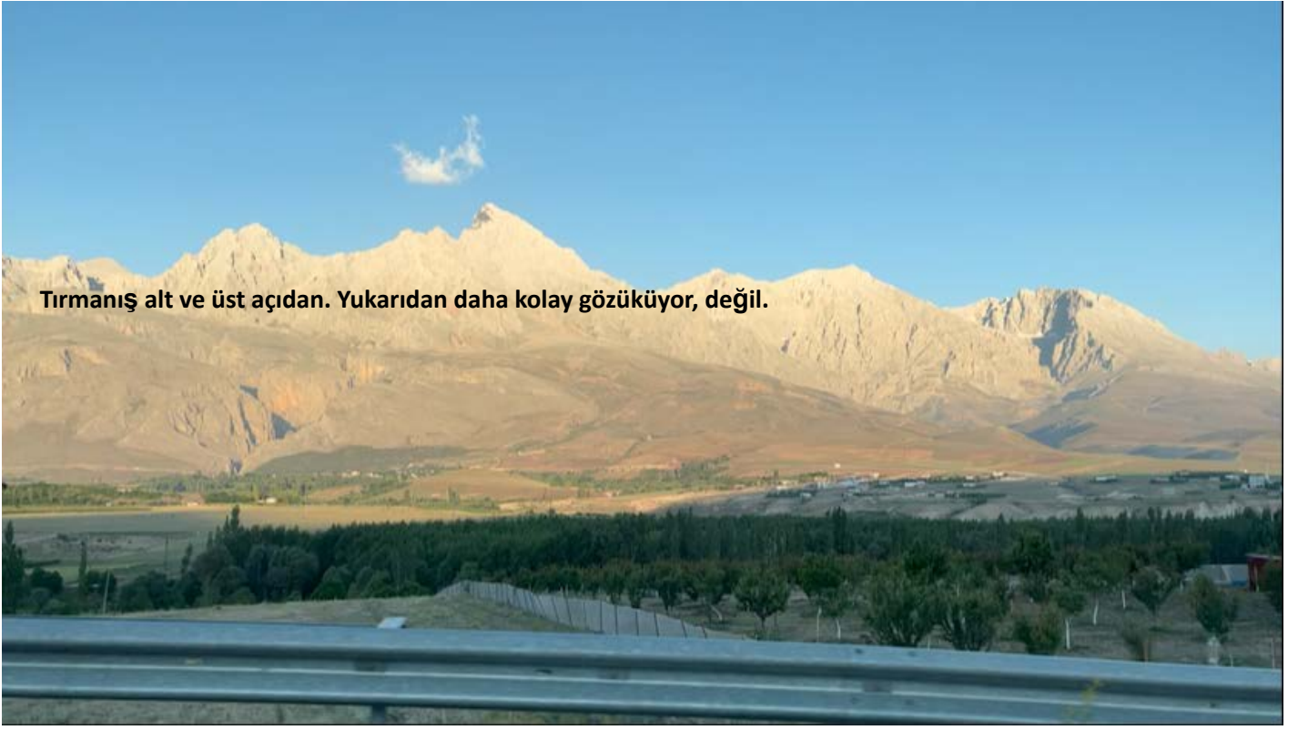
Aladağlar veya Anti-Taurus Mountains