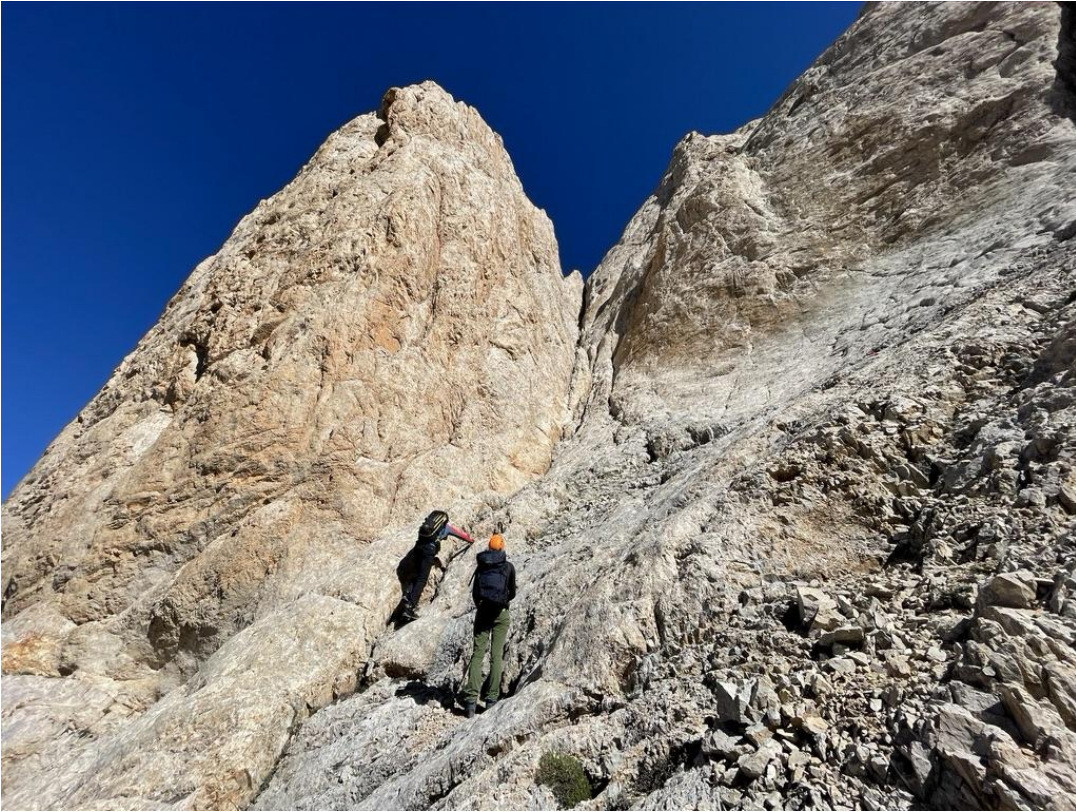
Güney bacası, giriş