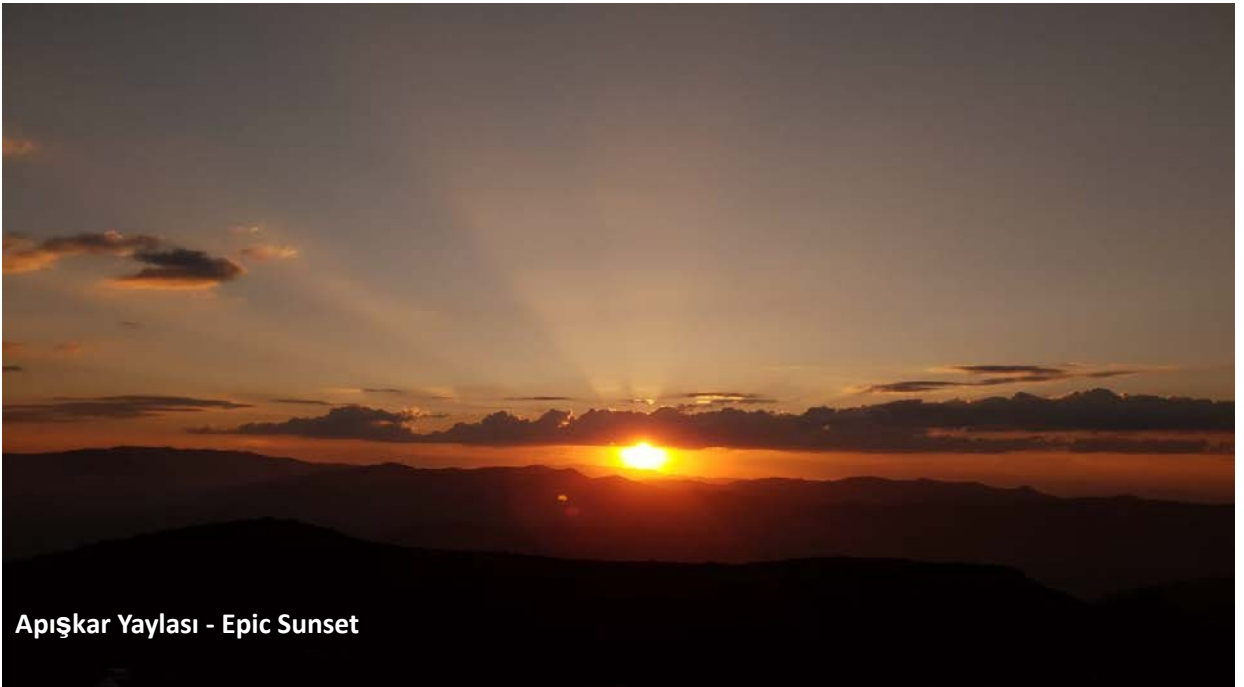
Apışkar Yaylası - Epic Sunset

Muhteşem bir gün batımına karşı sohbet edip ufak bir sandvici paylaştık. Sonra teknik malzemeleri aramızda dağıttık, çantalarımızı hazırladık, sularımızı doldurduk; zirve için 3lt su aldım. Yol boyunca tıka basa yemek yediğimiz için ve sabah 4'te hareket edeceğimiz için akşam yemeğini pas geçtik. Akşam 9'da yatmak için çadırlara dağıldık. Ben 10 dakika uyuduktan sonra uyandım, irtifadan olsa gerek pek uykum kalmamıştı. Adana'lı grup bizden 1 saat geç yattı. Tam uyudum derken gece 11'de çobanlar koyunları toplamaya başladı. 'Deh, kışşş, bürsst' bağrıışmaları, köpek havlamaları ve koyunların çanları karışımı bir patırtı 1-2 saat kadar sürdü. Neticede 2-3 saatlik bir uyku ile faaliyete başlama vakti gelmişti. Grup olarak hepimiz az uyumuştuk.