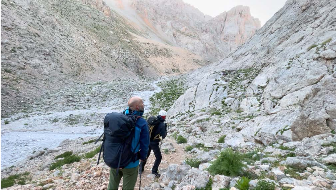
Tekepınarı, son su kaynağı

Sabah 4:40'ta Arpalık'tan Cimbar vadisine doğru yola çıktık. 1 saat kadar yürüyüşten sonra Tekepınarına vardık.