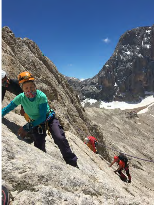
Foto 9: Varılan setin hemen arkasında slab'lardan çıkış ve akabinde sola yan geçiş.