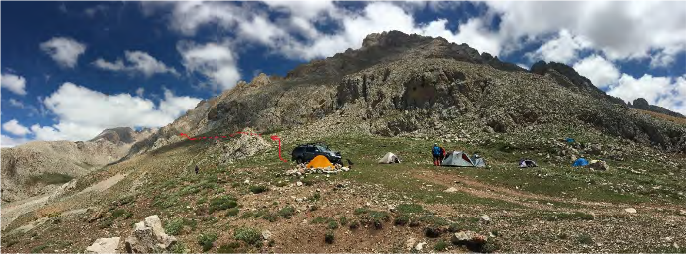
Foto 1: Arpalık Kamp Alanı. Apışkar'a yükseliş rotası işaretlenmiştir