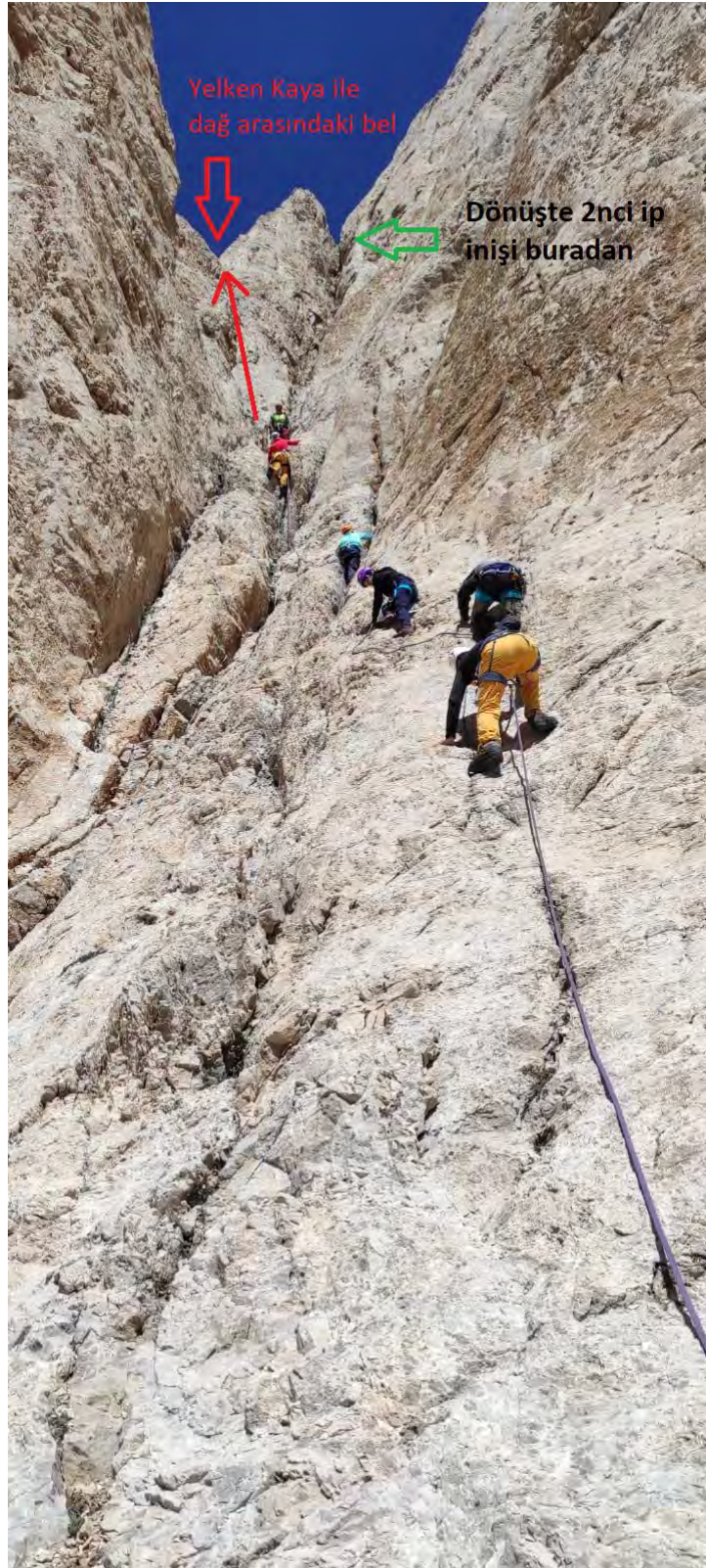
Foto 7: Baca etabını tırmanıyoruz. Kırmızı ok ikinci tırmanış noktamız olacak.