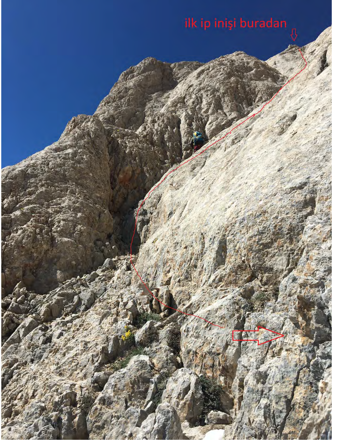
Foto 16: İlk ip iniş ile buradaki sete iniliyor. Aşağıdaki ok yönünde setin ulaştığı nokta bir sonraki fotoğrafta.