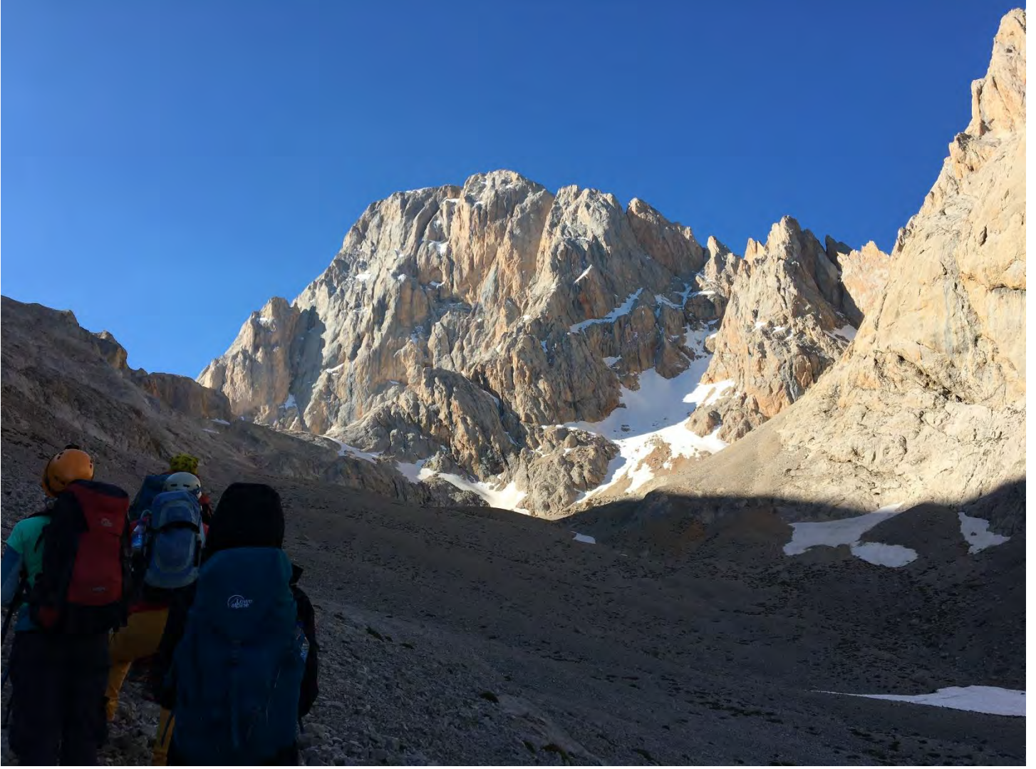
Foto 3: BDK Kuzey yüzünü gördükten bir süre sonra, sola dönerek hedefimiz olan Yelken Kaya'ya doğru yükseliyoruz.