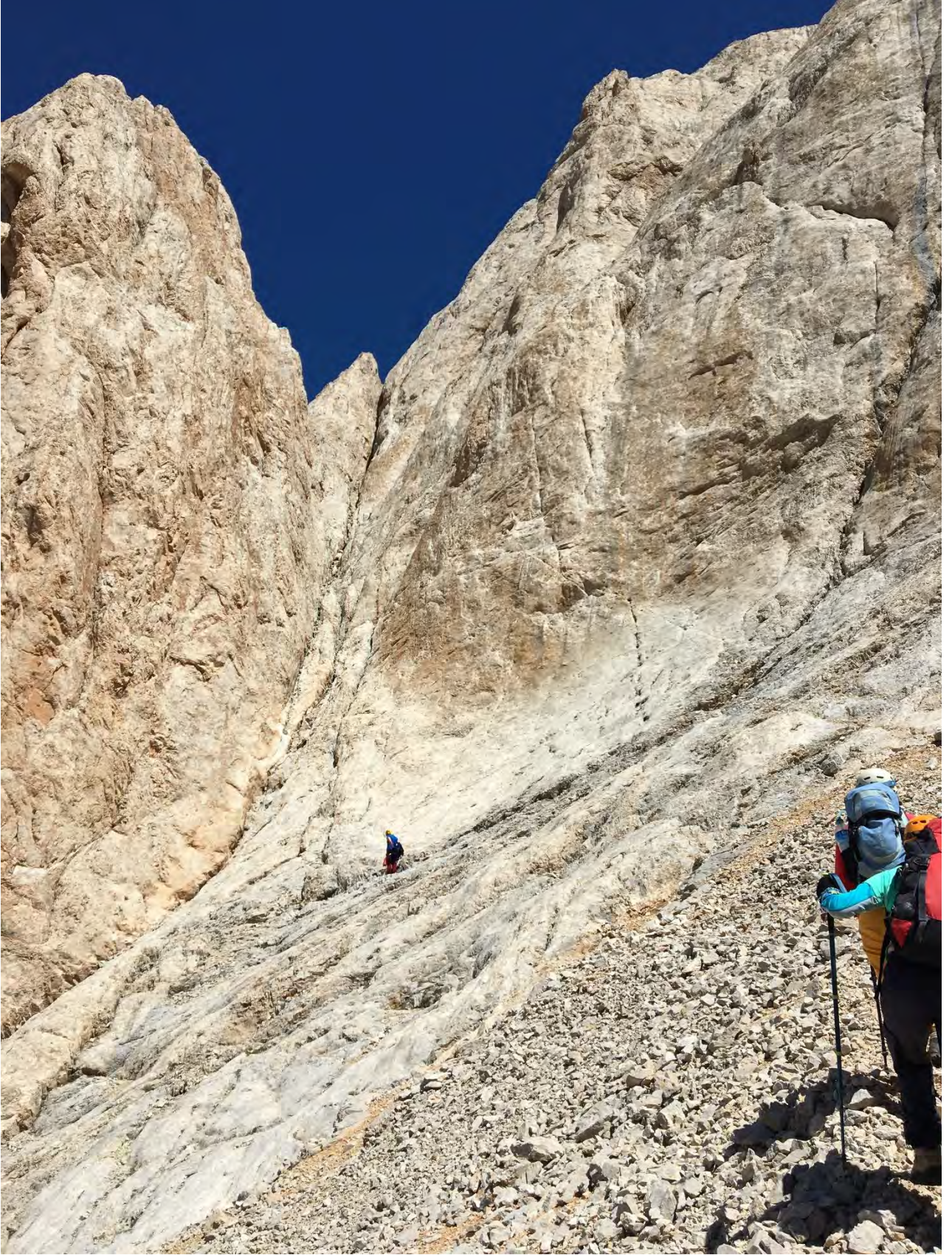
Foto 6: KDK Klasik Rotasının girişı, güney baca sistemine ulaştık.