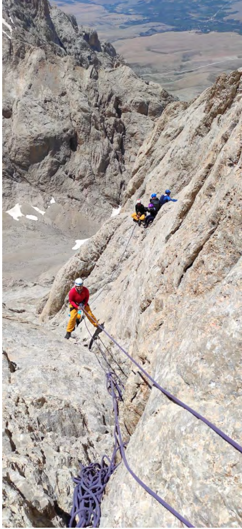
Foto 8: Yelken Kaya dađ arasındaki bele çıktıktan sonra ip inişı ile yan sete geçtik.