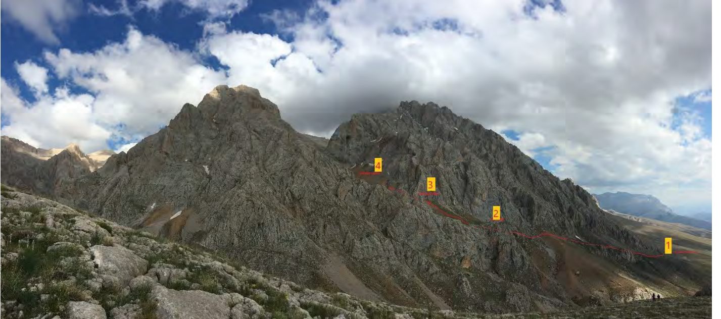
Foto 2: Arpalık kamp alanından, Apışkar Vadisine yükseliş rotası işaretlenmiştir.

1: Arpalık Kampı, 2: İlk Mola, 3: Apışkar girişi, 4: Apışkar Vadisi