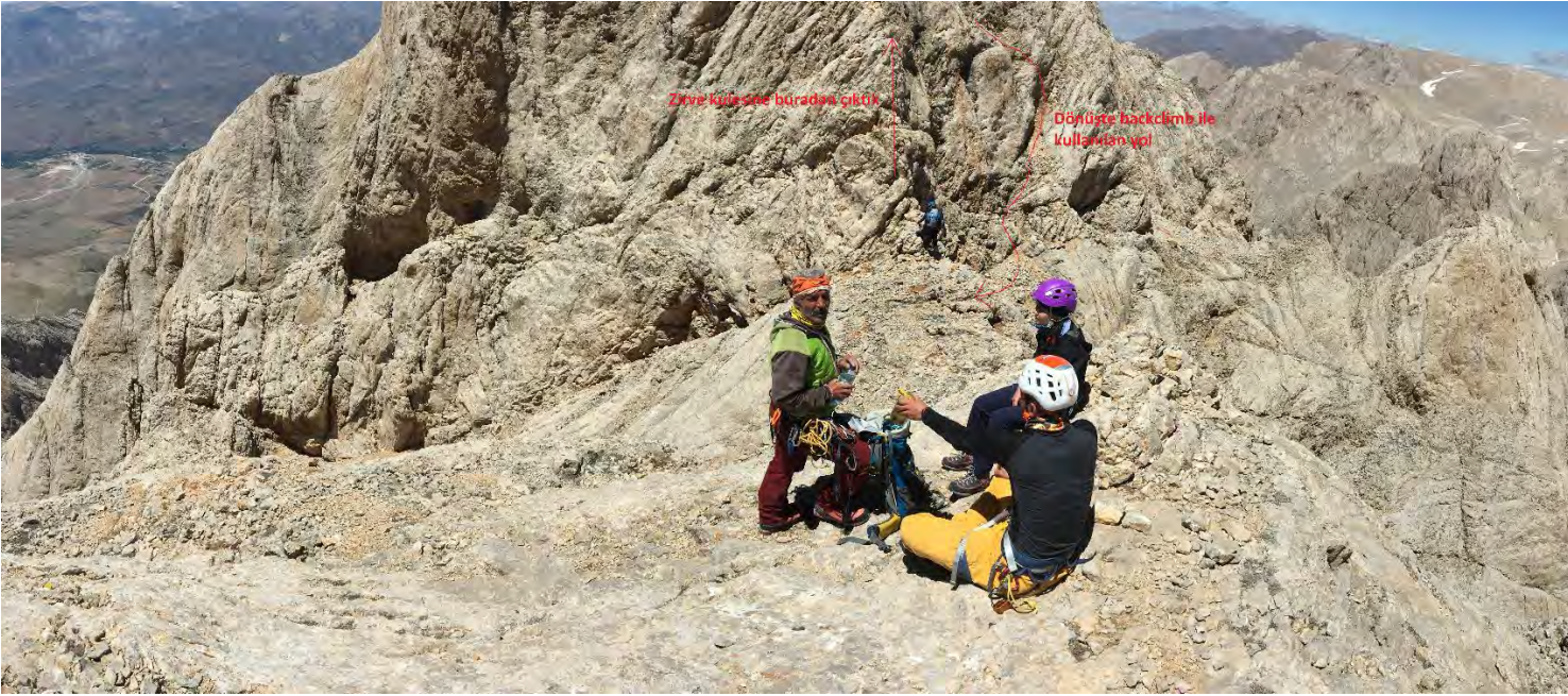
Foto 12: Zirve kulesine çıkış, ve dönüşte kullandığımız nispeten daha kolay yol.