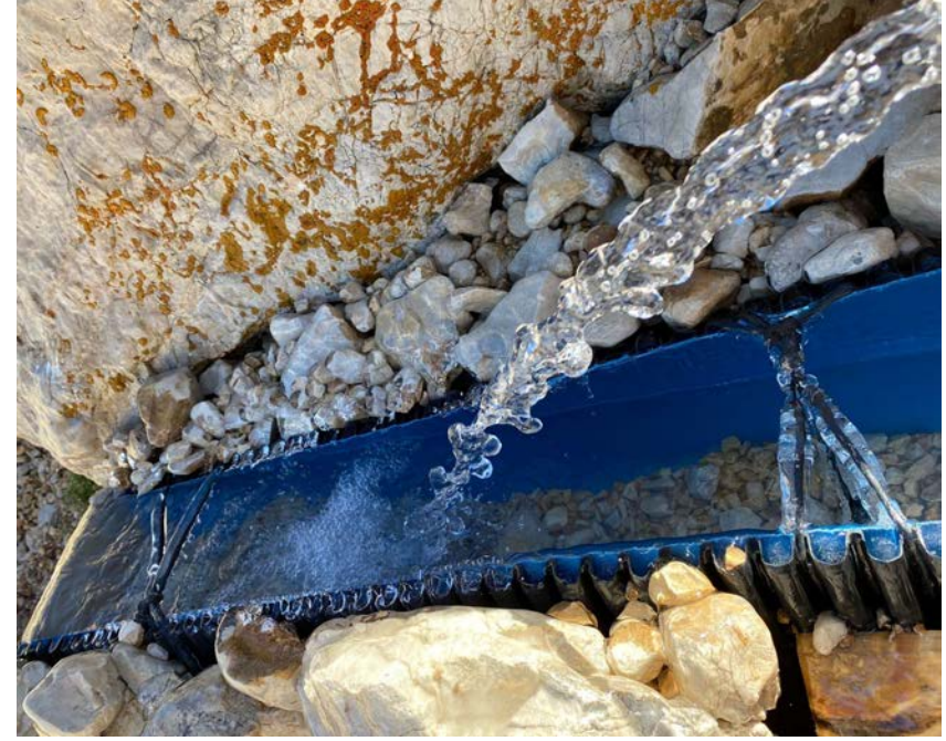
Molataşı'ndaki su kaynağı

Ertesi sabah saat 3:30'da zirveye çıkış planımıza uygun biçimde kalktık, ufak bir kahvaltı, çay, hazırlanma ve genel ayılma sürecinden sonra saat 04:13'te sayım alıp zirve çıkışına başladık. Çıkışımız açık ve bol yıldızlı fakat soğuk bir havada olsa da, yürüyüşe başladıktan yaklaşık 15 dakika sonra katman molası verdik. Ayrıca hepimiz zirveye çıkış sırasında eldiven kullanma ihtiyacını duyduk. Dik bir çıkışla başladığımız yürüyüşümüzde Saat 04:52'de Çelikbuyuran Pınarı'nda (3352m) bir su doldurma molası verdikten sonra yeni ay ve gün doğumunun eşliğinde Çelikbuyuran Aşığı'na doğru ilerlemeye devam ettik.