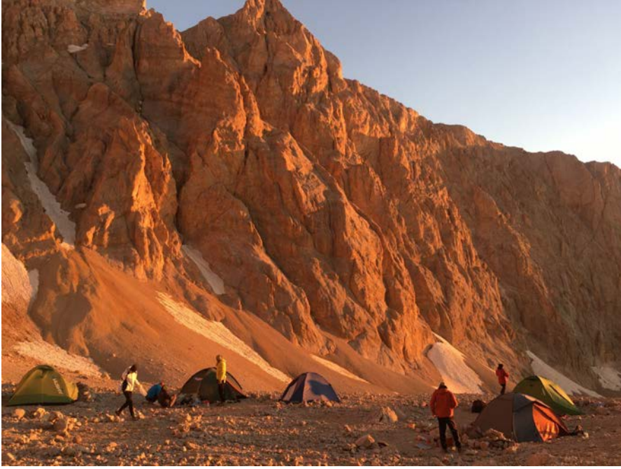
Molataşı Kamp alanı, günbatımı tam karşımızda