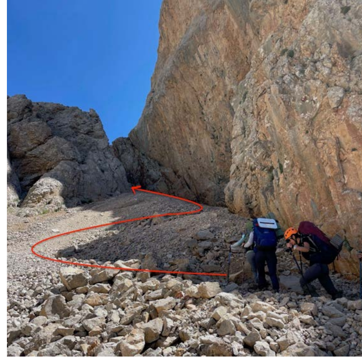
Kapıdan geçiş, bol ve düzensiz çarsaklı bir yol