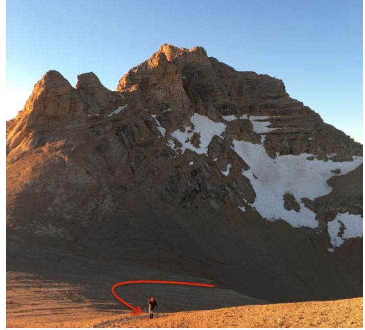
Çelikbuyuran Aşıtı'ndan zirveye giden yol ve liderimiz Yeşim

Gün ağarırken Çelikbuyuran Aşıtı'na vardık, geniş ve nispeten düzlük bir bölge olmasından ve gündeğumunun da etkisiyle bol bol fotoğraf ve selfie çektik, sonrasında da çok oyalanmadan zirvenin eteğinde bir su molası verip son tırmanışa doğru ilerledik. Aşıta kıyasla daha dikleşen yolda genelde düzensiz çarşak üstünden, mümkün olduğu zaman da slab üstünden yürüdük. Arada bir iki tane daha nefeslenme ve su molası vererek saat 06:42'de zirveye vardık (3721m). Kimse gruptan ciddi bir ayrılma yaşamadan toplamda 2 saat 29 dakikada zirve yaptık. Saat 7:30'da zirveden kamp alanına dönmek için yola koyulduk. Çıkışımıza göre nispeten daha hızlı hareket ettiğimizden dolayı yaklaşık 20 dakika içinde zirveden aşıtı varmıştık, üstüne de eğitimcilerimizin bize uygun bir inişte çarşak sörfü öğretmesi üstüne 8:14'te Çelikbuyuran Pınarı'nda ufak bir mola verip 08:32'de kamp alanına dönmeyi başardık. Son yolumuzdan önce uzun bir yemek ve toplanma molasını hak ettik.