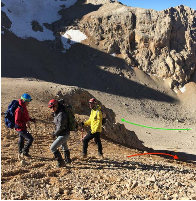
Çarşak sörfü öğrenme sırasında iki eğitmen ve bir dağcı. Yeşil ok sabah çıktığımız rotayı, kırmızı ok ise çarşak sörfü için indiğimiz yeri belirtiyor.