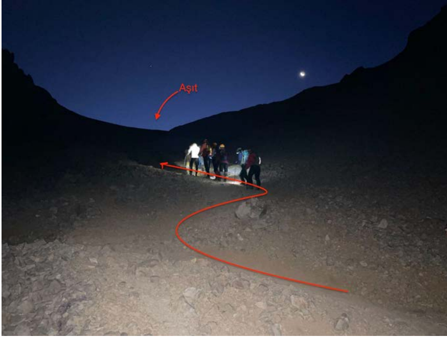
Aşıta doğru tırmanırken