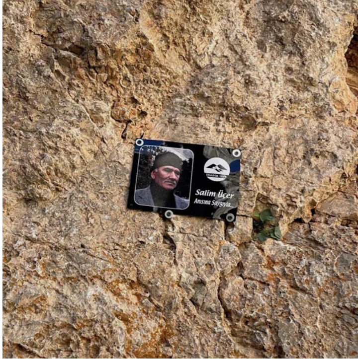
Salim Abi anısına kapıya İDADİK tarafından asılmış plaka

Yürüyüşümüz açık ve güneşli bir havada gerçekleşti. İki su molasından sonra saat 14:24'te kapıya vardık, 14:46'da kapıyı geçip su molası verdik, bundan sonra da iki tane daha su molası vererek saat 17:14'te Molataşı'ndaki kamp alanına (3105m) vardık. Yol esnasında bir kişide biraz göz kapanması ve yorgunluk şikayeti olması dışında herkes güzel bir tempoda ilerledi, varışımız ise toplam 4 saat 20 dakika sürdü. Yorgun ama gururlu bir şekilde kamp alanına kurulduk, telefonu çekenden Madrigal ile başlayarak müzik açtık ve sohbet eşliğinde yemeklerimizi yiyip dinlendik. Mehmet Bey Molataşı'na hortumla su çekmiş olması da bizim şansımıza oldu, su için Çelikbuyuran'a kadar çıkmamıza gerek kalmadı. Kamp yerinin hemen yanında duran kaynak biz oradayken bolca akmasına rağmen buraya ileride yapılacak faaliyetlerden önce suyun olduğunu teyit etmek muhtemelen iyi bir fikir olur. Saat 20:45 civarında liderimiz Yeşim ertesi sabah için kalkış saati, rota ve hazırlık için gerekenleri anlattıktan sonra istirahate çekildik, 21:00'da mutlak sessizliğe geçtik.