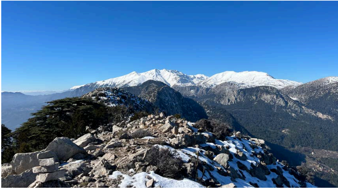
Zirvede ve kuzey yamaçlarında kar vardı. Arkada görünen Tunç Dağı.