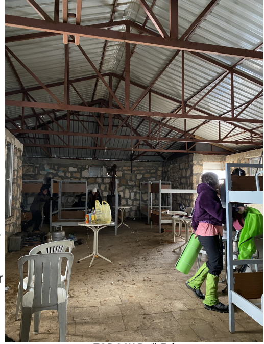
TODOSK Dağ Evi

Anlatılanlara göre, bir zamanlar TODOSK tarafından inşa ettirilen ve bakımı yapılan dağ evini Milli Parklar aldıktan sonra ev oldukça bakımsız kalmış. İçerideki ranzaların metal iskeletleri hâlâ iyi durumda ama üzerinde yatmak için yerleştirilen ahşap ranza paletlerinin birçoğu eksik veya hasarlı. Çatı da yer yer akıtıyor. Evin ana kapısının kilidi bozulduğu için açamadık. Kilitlenmeyen bir pencereden ve anahtarın açtığı arka kapıdan girme seçenekleri ise hâlâ işe yarar durumda. Her şeye rağmen bu irtifa ve soğukta konaklamak için gayet rahat bir seçenek. Çadırla uğraşma derdi yok ve dışarıdaki hava koşullarından korunarak (biz gittiğimizde yağmur yağıyordu) zaman geçirebileceğin büyük bir alanı var.