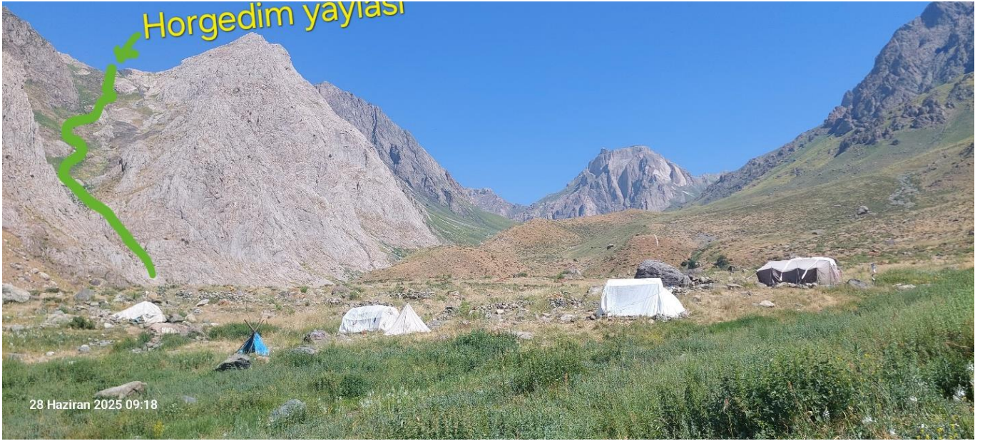
Serpel'den Horgedim'e bakış

O gece, Horkadim ve zirve için gerekli malzemeleri toparlayıp ertesi gün sırtlanacağımız çantalarımızı hazırladık. Sabah 7.30 civarı kalktık. Güzelce kahvaltılarımızı yaptık ve Horkadim'e geçmek üzere yola koyulduk.