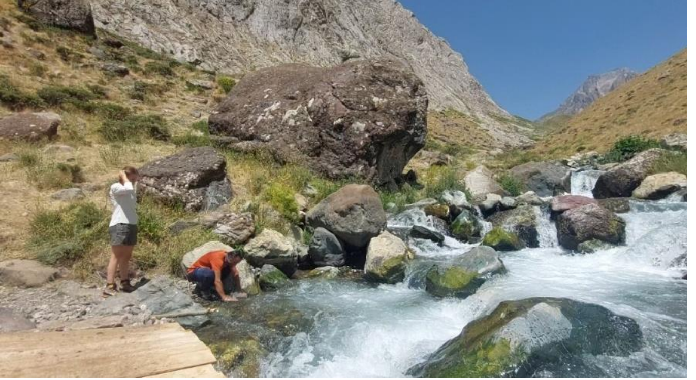
Köprü'de ilk mola

Kamp yüküyle çıktığını düşünürsek, mümkün olduğunca az ve hafif eşya alınması şiddetle tavsiye edilir. Biz bu çıkışı yaklaşık 5 saatte tamamladık. Bu rota ve sonrası zirve yolculuğu sağlam kondisyon istiyor.