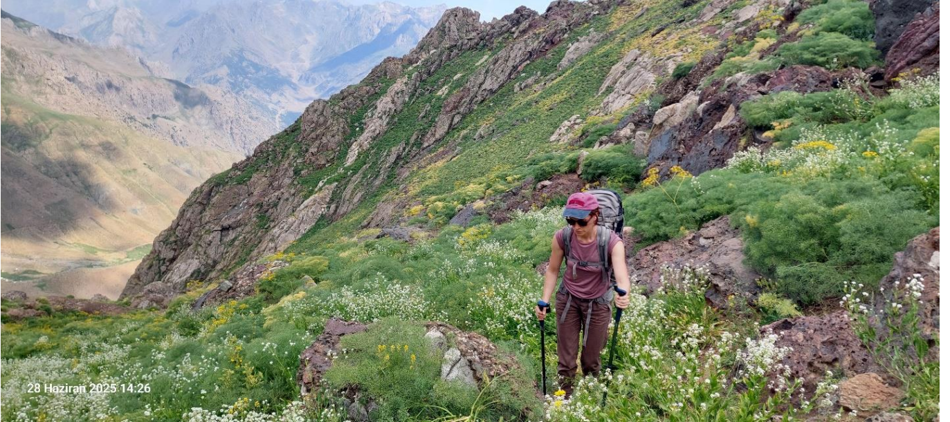
Öyle Tarzan gibi gezersen, yanmak da kaçınılmaz oluyor tabii!

Kamp yüküyle çıktığını düşünürsek, mümkün olduğunca az ve hafif eşya alınması şiddetle tavsiye edilir. Biz bu çıkışı yaklaşık 5 saatte tamamladık. Bu rota ve sonrası zirve yolculuğu sağlam kondisyon istiyor.